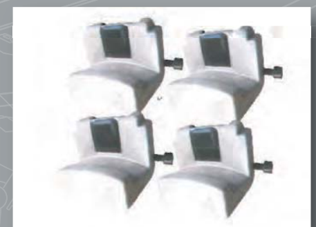
Zestaw ochronny do alufelg