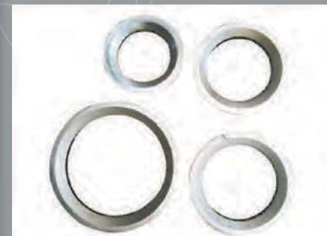
Pierścienie ochronne do alufelg