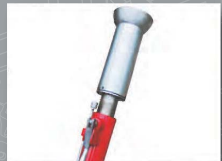
Wałek do kół bezdętkowych