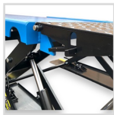
Rozkładany, blokowany najazd