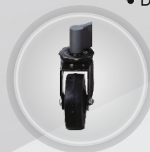
Nylonowe koła o wysokiej wytrzymałości