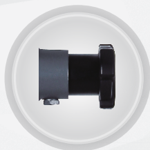
Zawór spustowy dwustopniowy