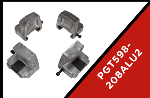
NAKŁADKI OCHRONNE NA SZCZĘKI DO FELG ALU