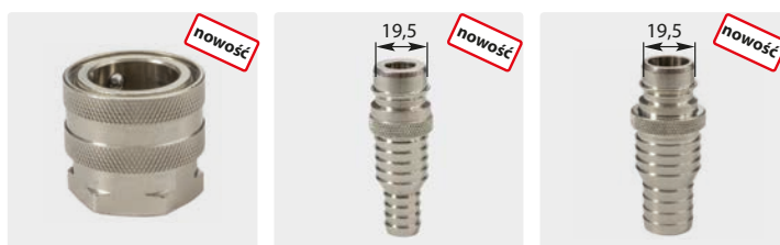
ST-45. Szybkozłącze : 3/4" GW