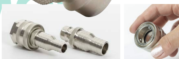
ST-45 wtyczka / króciec do węża for 13-25 mm