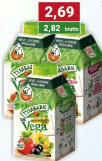
Tymbark Vega sok prowansalskie pola, słoneczny meksyk, śródziemnomorski ogród 500 ml /6 szt.