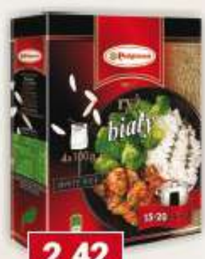
Polgreen ryż biały 4 x 100 g /12 szt.