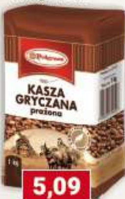
Polgreen kasza gryczana prażona 1 kg /10 szt.