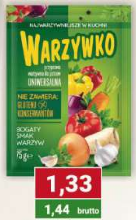
Warzywko 75 g / 30 szt.