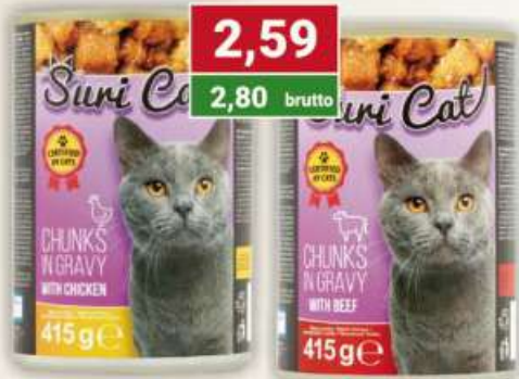
Suri cat karma dla kota z drobiem 410 g / 20 szt.