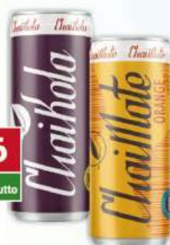
Chaikola, Chaimate napój gazowany puszką 330 ml /24 szt.