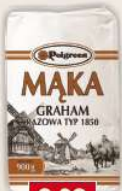
Polgreen mąka graham typ 1850 900 g /10 szt.