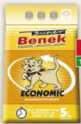
Benek żwirek 5 l economic