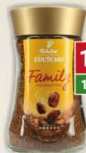
Tchibo family kawa rozpuszczalna 100 g / 6 szt.