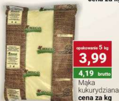
Mąka kukurydziana cena za kg