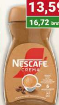
Nescafe creme kawa rozpuszczalna 100 g / 8 szt.