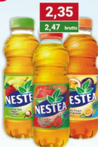
Nestea Ice Tea gruszka-liczi, marakuja-trawa cytrynowa, truskawka-aloes 500 ml /12 szt.