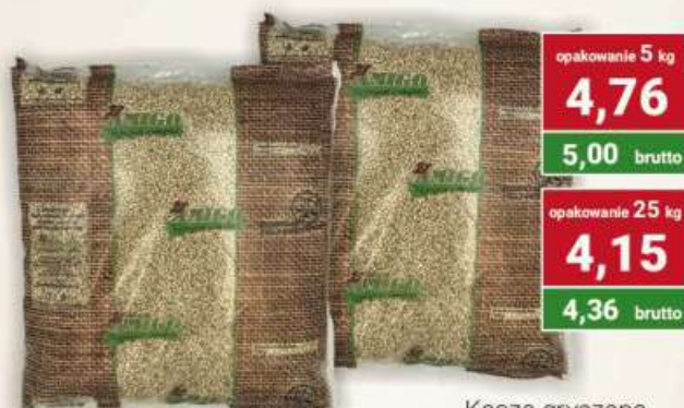
Kasza gryczana biała nieprażona cena za kg