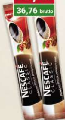
Nescafe Classic 2 g x 100 szt. (paluszek)