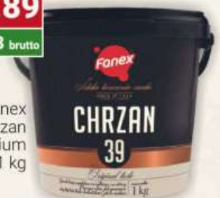
Fanex chrzan premium 1 kg