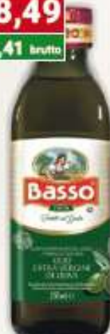
Basso oliwa z oliwek extra vergine 0,25 l / 6 szt.