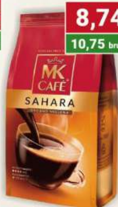
MK Cafe Sahara kawa mielona 250 g / 12 szt.