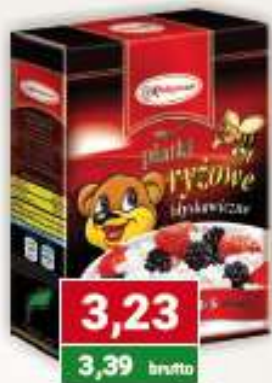
Polgreen plątki ryżowe błyskaw. 300 g karton /12 szt.