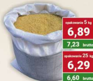
Kasza bulgur grys gruba cena za kg