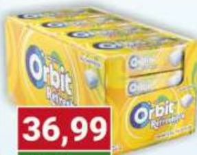
Orbit guma draże Tropical 16 szt.