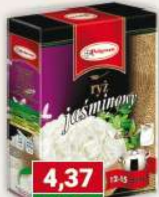
Polgreen ryż jaśminowy 4 x 100 g /6 szt.