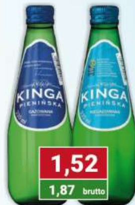
Kinga w szkle naturalna zielona, niebieska 330 ml /12 szt.