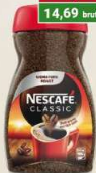
Nescafe Classic kawa rozpuszczalna 100 g / 12 szt.