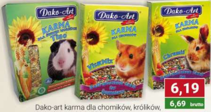
Dako-art karma dla chomików, królików, świnek morskich 500 g / 10 szt.