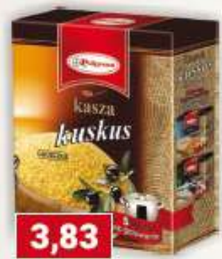
Polgreen kasza kuskus 300 g /6 szt.