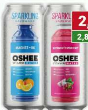
Oshee Sparkling magnez+B6, witaminy i minerały puszką 500 ml /12 szt.