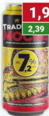
Piwo puszką Tradycyjne mocne 500 ml /24 szt.