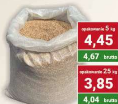
Kasza gryczana palona cena za kg