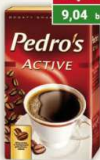
Pedro's kawa mielona 250 g / 12 szt.