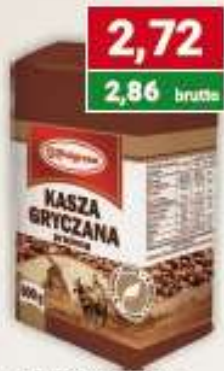
Polgreen kasza gryczana prażona 500 g /14 szt.