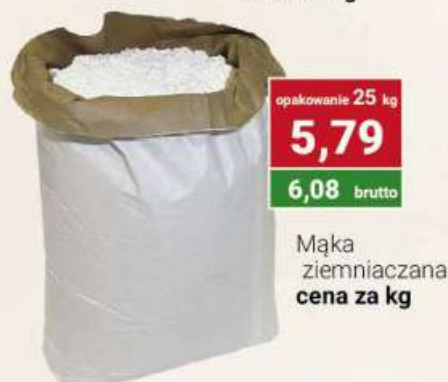
Mąka ziemniaczana cena za kg