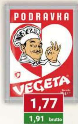
Vegeta 70 g / 35 szt.