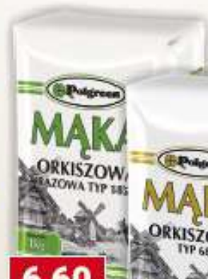
Polgreen mąka orkiszowa razowa typ 1850, orkiszowa typ 680 1 kg /10 szt.