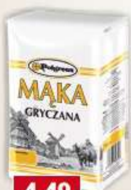
Polgreen mąka gryczana 500 g /12 szt.