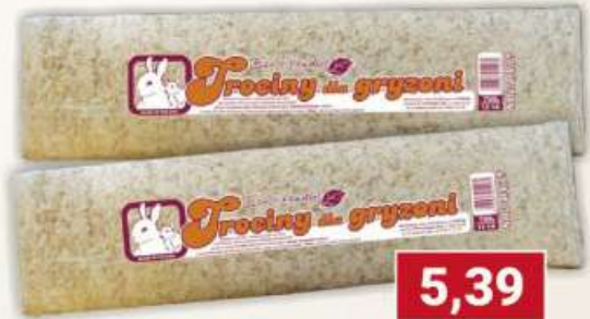
Natural-vit trociny ściółka 700 g / 12 szt.