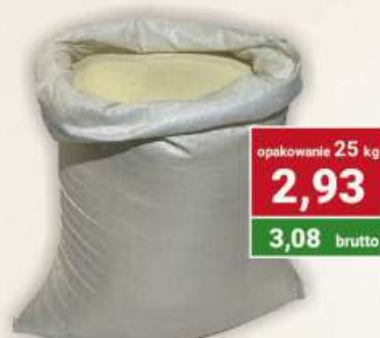
Kasza manna cena za kg