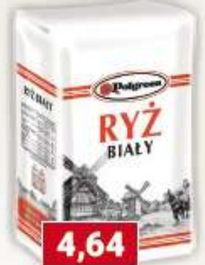
Polgreen ryż 1kg papier /10 szt.