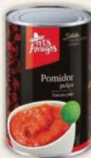
Fanex Tres Amigos koncentrat pomidorowy 28/30% 4,5 kg