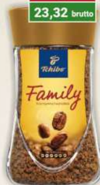
Tchibo Family kawa rozpuszczalna 200 g / 6 szt.