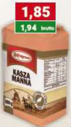
Polgreen kasza manna 500 g folia /14 szt.