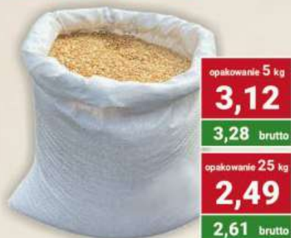
Groch konsumpcyjny połówki cena za kg