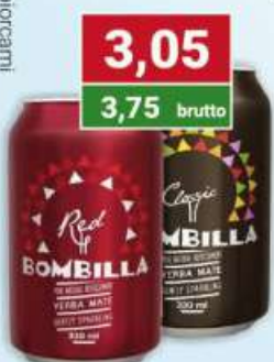
Bombilla Yerba Mate classic, red 330 ml /12 szt.