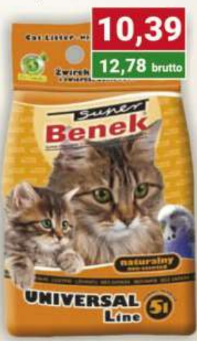
Benek żwirek 5 l universal