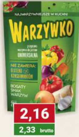
Warzywko 200 g / 12 szt.