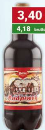
Podpiwek 1 l