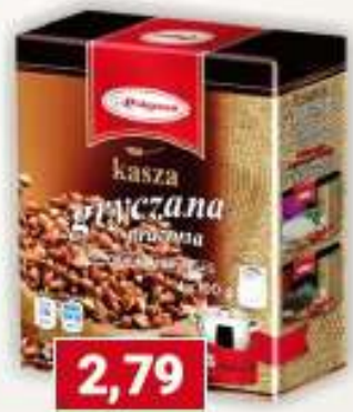
Polgreen kasza gryczana 4 x 100 g /12 szt.