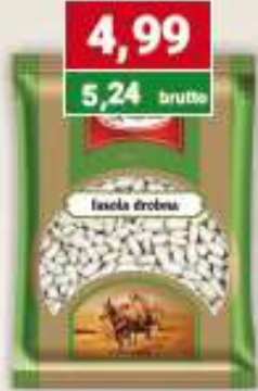
Polgreen fasola drobna 500 g /14 szt.