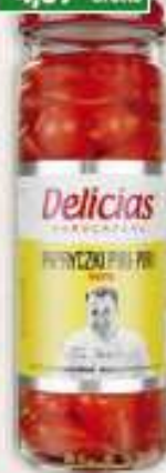
Delicias papryczki piri-piri 100 g / 12 szt.