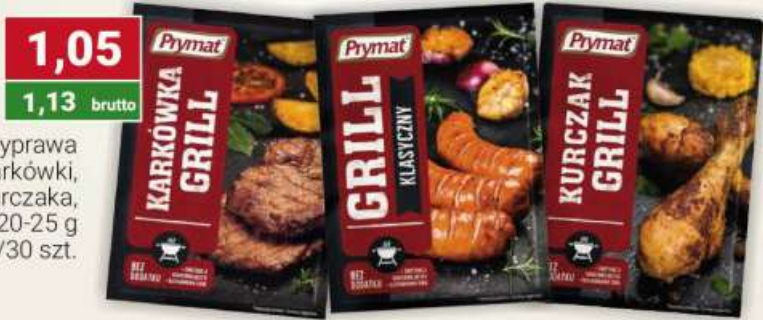
Prymat przyprawa do grilla do karkówki, klasyczna, do kurczaka, ziołowa 20-25 g / 25/30 szt.