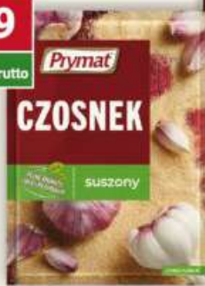
Prymat przyprawa bazylia, cebula, czosnek, gorczyca, lubczyk, majeranek, oregano, rozmaryn 10-30 g / 20/25 szt.