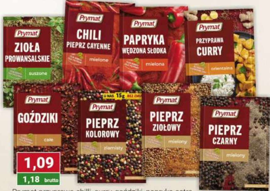
Prymat przyprawa chilli, curry, goździki, papryka ostra, słodka, słodka wędzona, pieprz biały, czarny, kolorowy ziarno, ziołowy, tymianek, zioła prowansalskie 10-20 g / 18/30 szt.