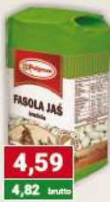
Polgreen fasola średnia-Jaś 500 g /14 szt.