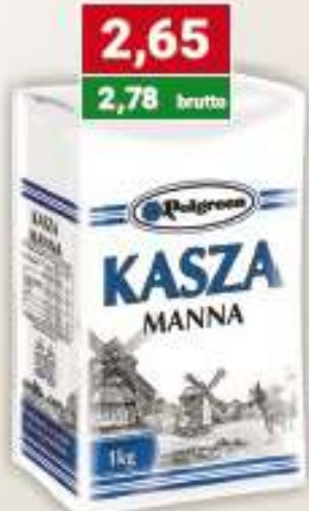
Polgreen kasza manna 1 kg /10 szt.