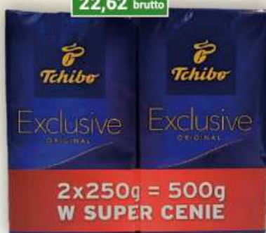
Tchibo Exclusive kawa mielona 250 g dwupack / 12 szt.