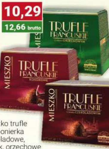
Mieszko trufle bombonierka czekoladowe, koniak, orzechowe 175g /16 szt.