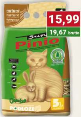
Benek żwirek 5 l pinio