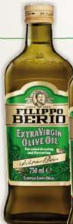
Filippo Berio oliwa extra virgin 0,75 l / 6 szt.