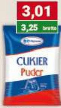
Polgreen cukier puder 400 g /12 szt.