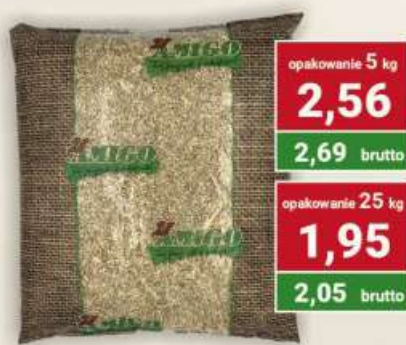
Kasza jęczmienna pęczak cena za kg