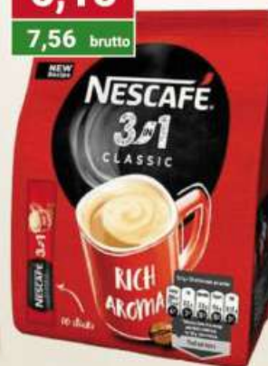
Nescafe 3w1 w torebce 16,5 g x10 szt / 18 szt.