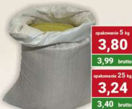
Kasza jaglana cena za kg