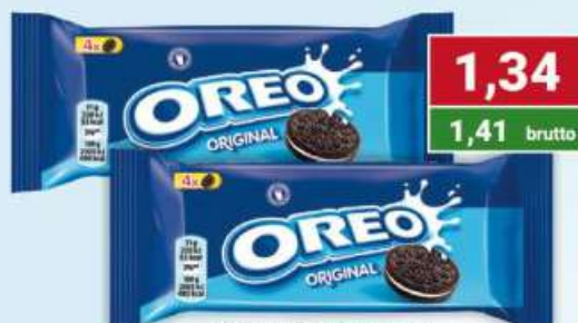
Milka ciastka Oreo 44 g / 32 szt.