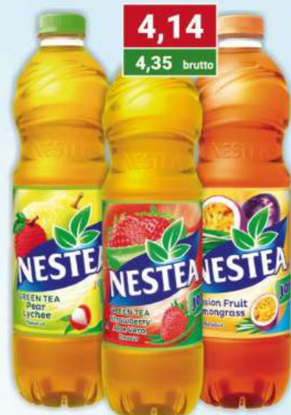
Nestea ananas-mango, truskawka-aloes, gruszka-liczi, marakuja-trawa cytrynowa 1,5 l /6 szt.