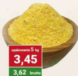
Kasza kukurydziana cena za kg