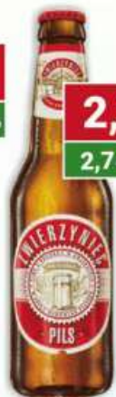
Piwo but.b/z Perła Zwierzyniec 330 ml /20 szt.