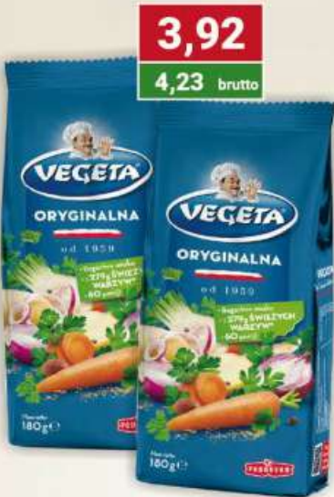
Vegeta 180 g / 18 szt.