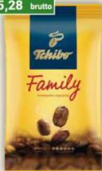
Tchibo Family kawa mielona 100 g / 20 szt.