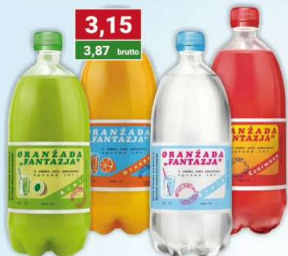
Oranżada Fantazja biała, czerwona, orange, kiwi 1 l