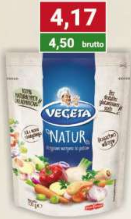
Vegeta przyprawa natur 150 g / 12 szt.