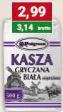
Polgreen kasza gryczana biała 500 g /12 szt.