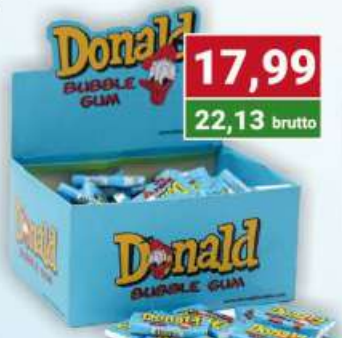
Donald guma balonowa 100 szt.