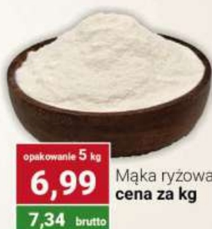
Mąka ryżowa cena za kg