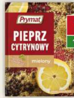
Prymat pieprz cytrynowy 20 g / 30 szt.