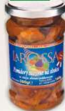
Larossa pomidory suszone 280 g / 6 szt.