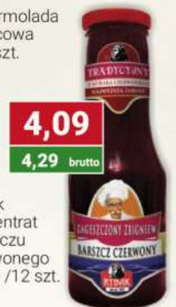
Rybak marmolada wielowocowa 550 g /6 szt.