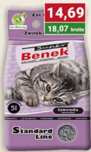
Benek żwirek 5 l lawenda standard