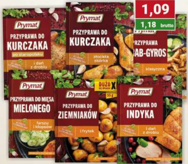
Prymat przyprawa do gulaszu, indyka, kurczaka po staropolsku, złocista skórka, mięsa mielonego, do ziemniaków i frytek, kebab-gyros 20-30 g / 25 szt.