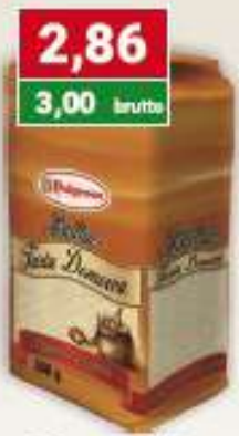
Polgreen bułka tarta 500 g papier /12 szt.