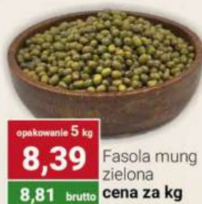
Fasola mung zielona cena za kg