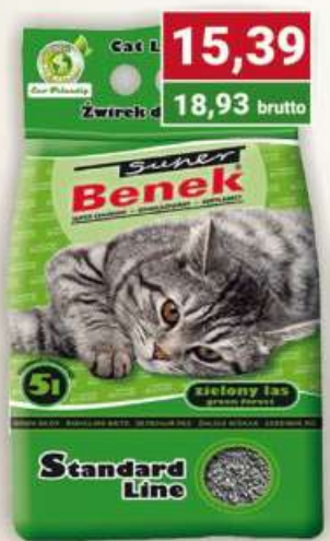
Benek żwirek 5 l standard zielony