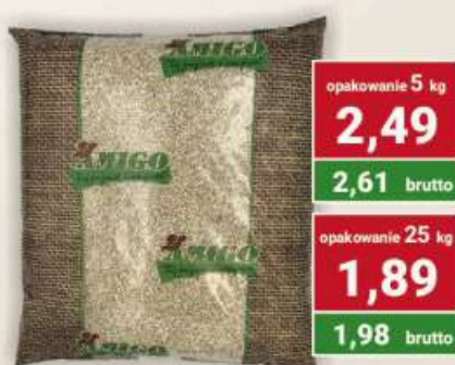
Kasza jęczmienna wiejska cena za kg