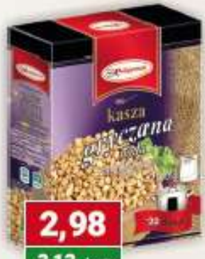
Polgreen kasza gryczana biała 4 x 100 g /12 szt.