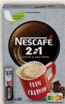
Nescafe 2w1 kartonik 8 x 10 szt. / 8 szt.