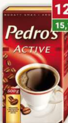
Pedro's kawa mielona 500 g / 12 szt.