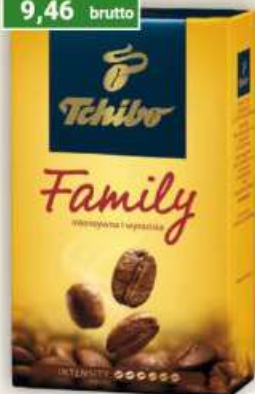
Tchibo Family kawa mielona 250 g / 12 szt.