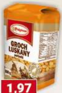
Polgreen groch luskany połówki 500 g /14 szt.