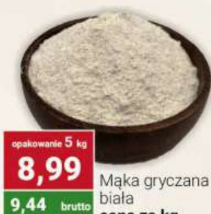
Mąka gryczana biała cena za kg