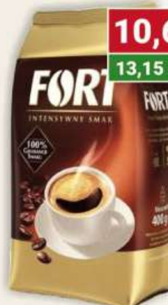
Kawa Fort mielona 400 g / 10 szt.