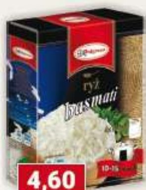
Polgreen ryż basmati 4 x 100 g /6 szt.