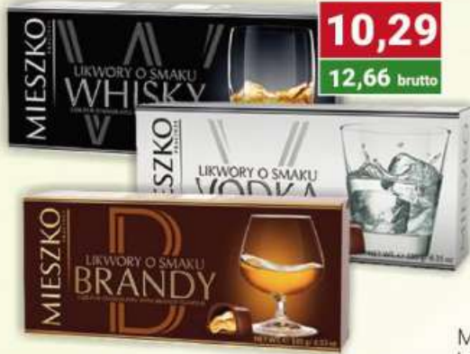
Mieszko Likwory bombonierka brandy, whisky, wódka 180 g /12 szt