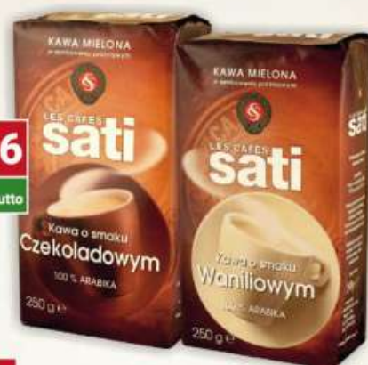
Sati kawa mielona waniliowa, czekoladowa 250 g / 12 szt.