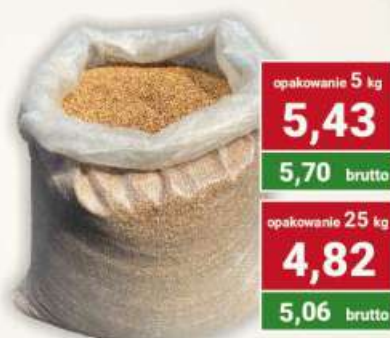
Kasza gryczana ciemna prażona cena za kg