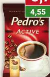
Pedro's kawa mielona 100 g / 15 szt.