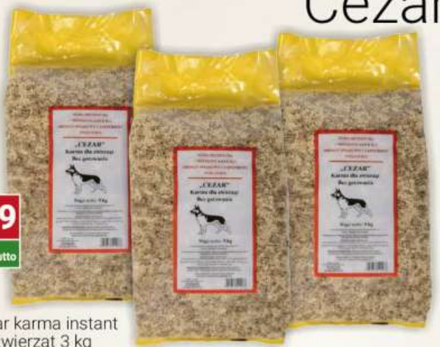
Cezar karma instant dla zwierząt 3 kg