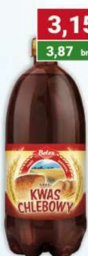
Kwas chlebowy 1 l