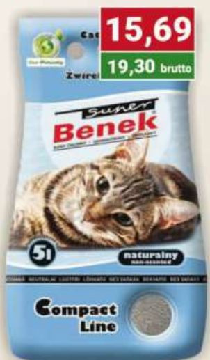
Benek żwirek 5 l kompakt niebieski