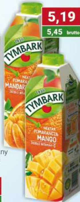
Tymbark nektar pomarańcza-mandarynka, pomarańcza-mango 1 l /6 szt.