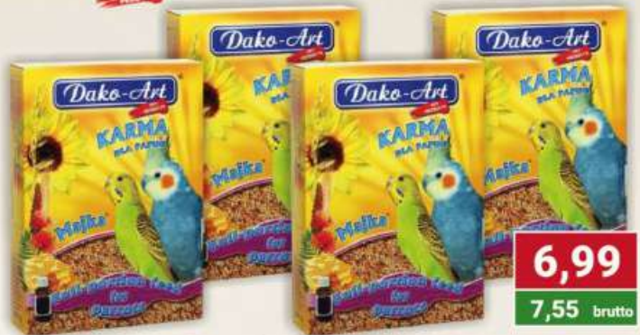
Dako-art karma dla papug majka 500 g / 10 szt.