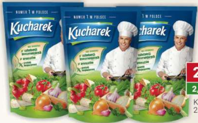
Kucharek 200 g / 20 szt.