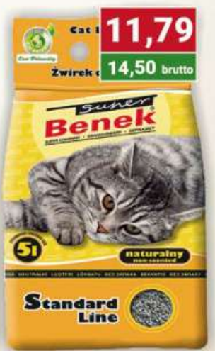
Benek żwirek 5 l standard żółty naturalny