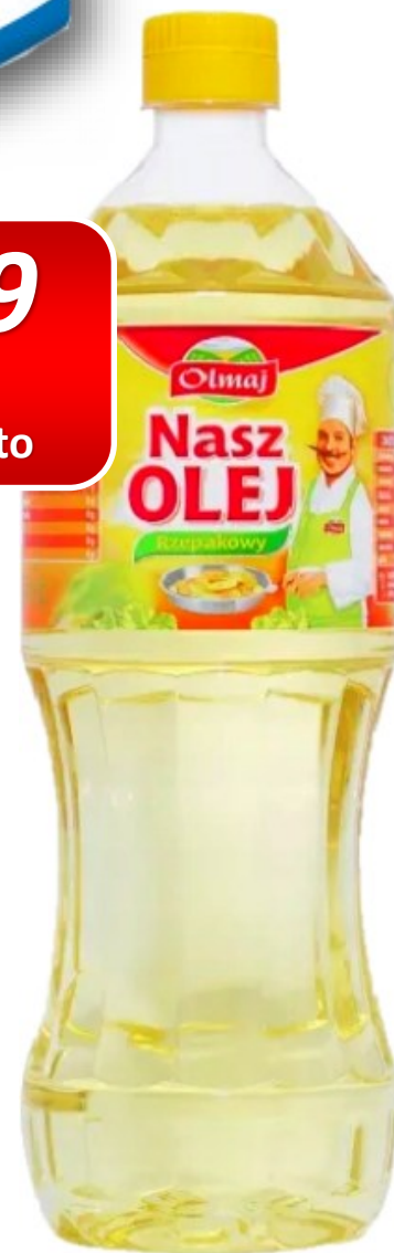
Olmaj olej uniwersalny rzepakowy 900ml [12]