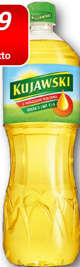
Kujawski olej 1L [15]