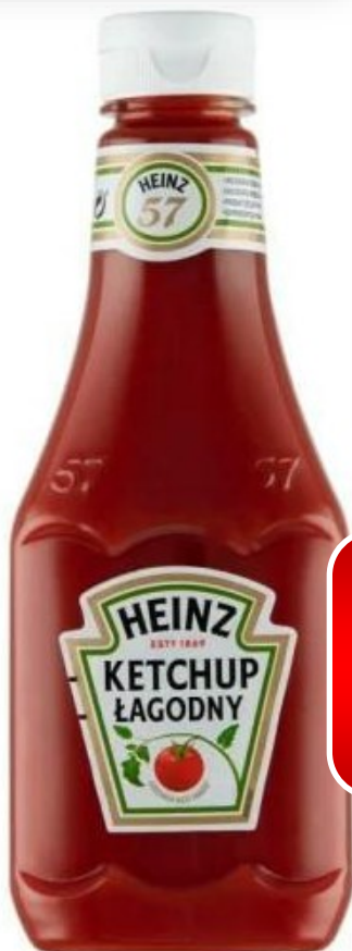
Heinz ketchup łagodny, pikantny 455g [8]