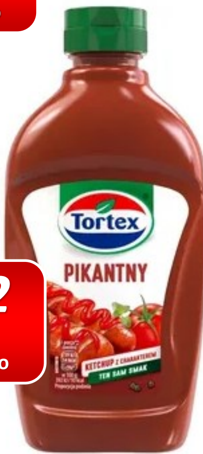
Tortex ketchup łagodny, pikantny 480g [12]