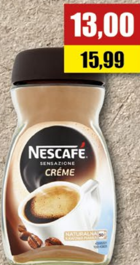
NESCAFÉ CREME; 100 g