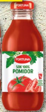
FORTUNA; soki z słomką, różne smaki; 0,2 l FORTUNA; sok pomid./tabasco, 0,3 l