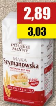
Mąka Szymanowska; TYP 480; 1 kg