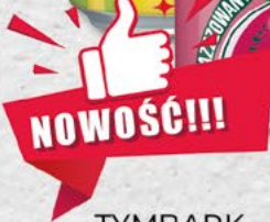
TYMBARK napoje; różne smaki; 0,33 l