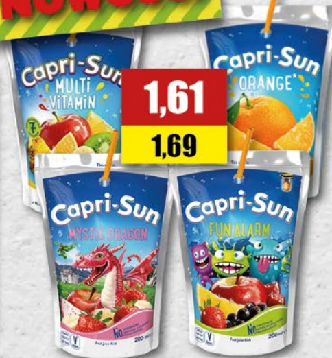
CAPRI-SUN; asortyment; 0,2 l