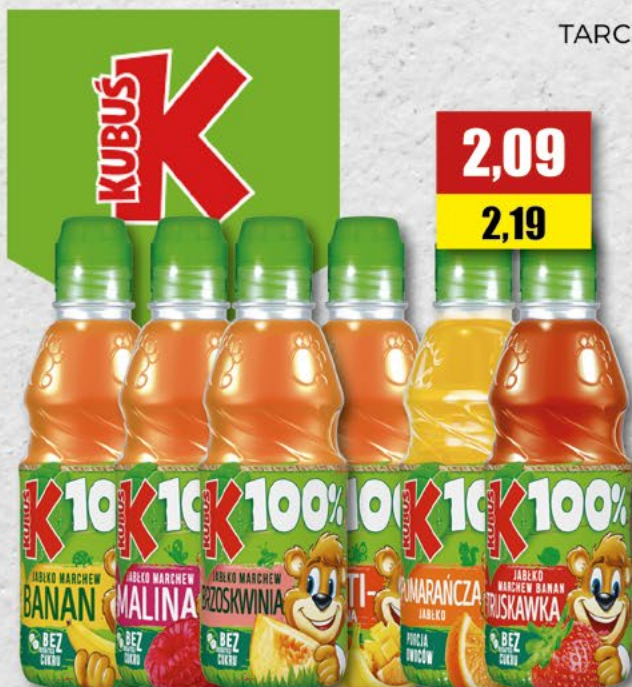
TARCZYN; różne smaki; 0,33 l