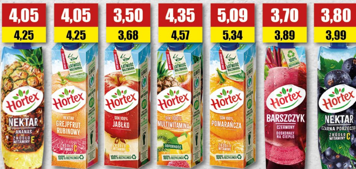
HORTEX; ananas; 1 l