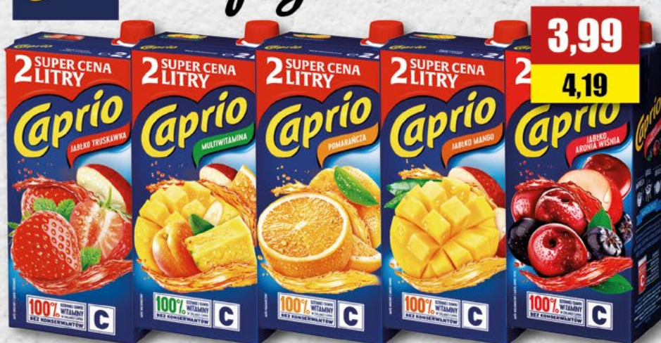
CAPRIO; napój, różne smaki; 2 l