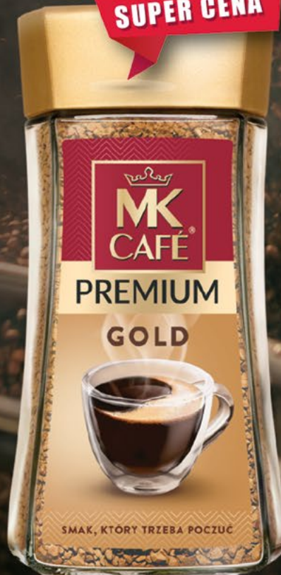
kawa rozpuszczalna 175 g