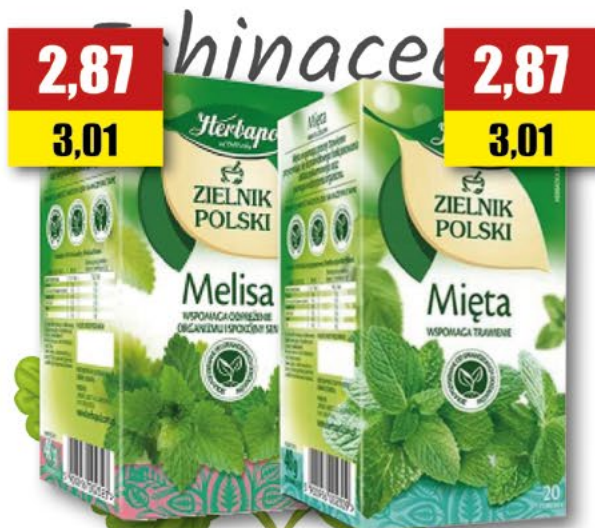
HERBAPOL melisa, mięta; 20 T