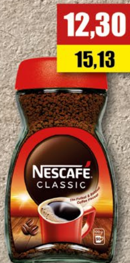
NESCAFÉ 100 g