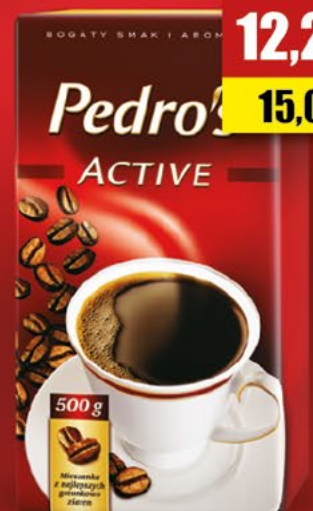
kawa mielona 500 g