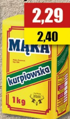
Mąka kurpiowska; 1 kg