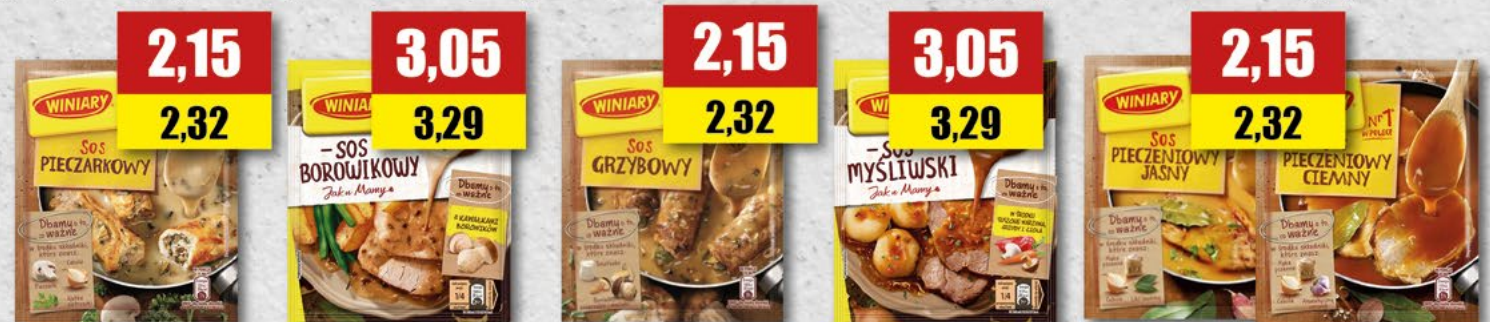
WINIARY sos pieczarkowy; 33 g