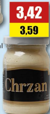
BAJM chrzan, 250 ml