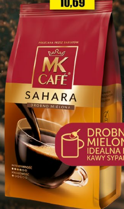
kawa mielona 250 g