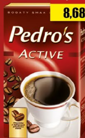
kawa mielona 250 g