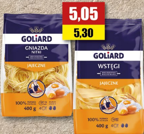
GOLIARD gniazda grube, średnie, wstęga, gwiazdka; 400 g