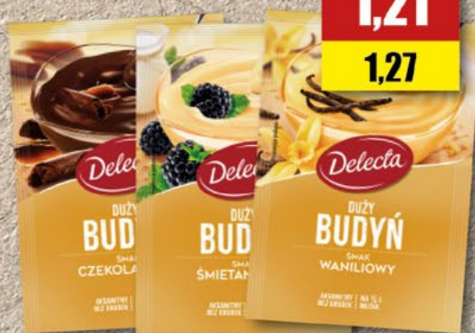
DELECTA budyń czekoladowy, śmietankowy, waniliowy; 4 g