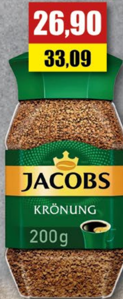
JACOBS KRONUNG rozpuszczalna; 200 g