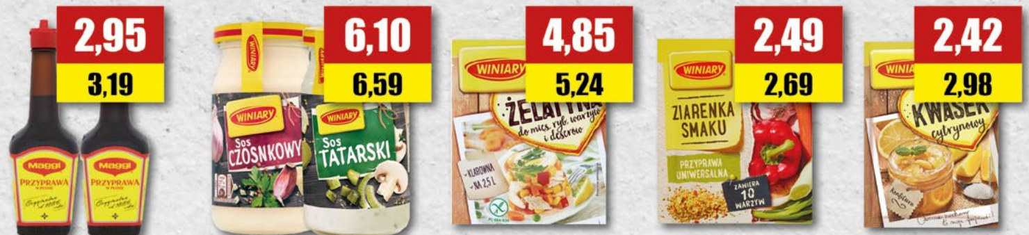
WINIARY maggi; 200 ml