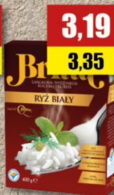
BRITTA ryz; 4x100 g