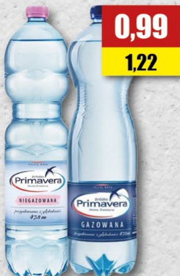
PRIMAVERA; gaz/ngaz; 1, 5 l