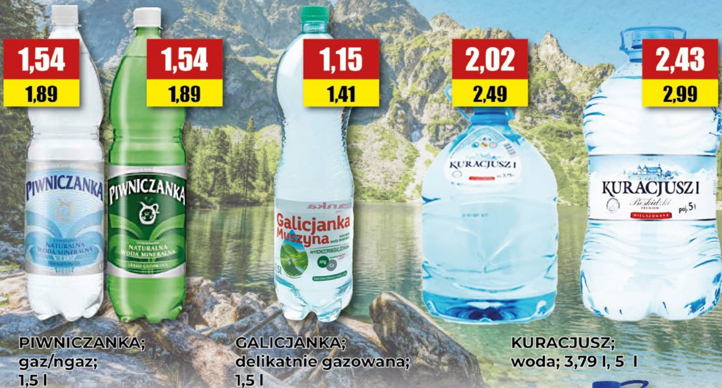
PIWNICZANKA; gaz/ngaz; 1,5 l