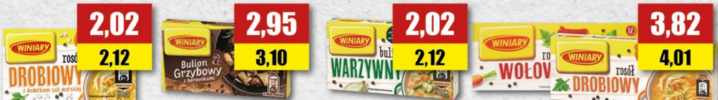
WINIARY kostka drobiowa; 60 g