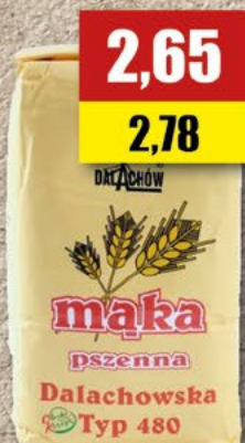
Mąka Dalachów; 1 kg