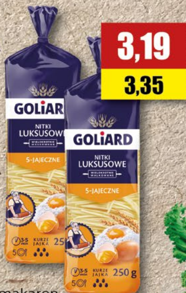
GOLIARD makaron LUX; 250 g