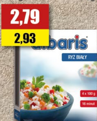
10 Ryż Albaris; 4x100 g