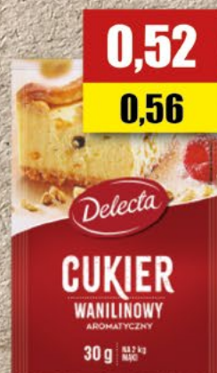
DELECTA cukier waniliowy;