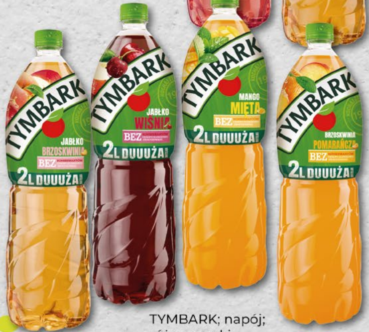
TYMBARK; napój; różne smaki; 2 l