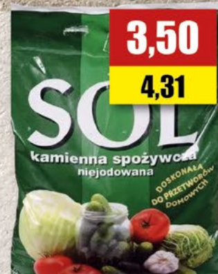
Sól kamienna niejodowana; 3 kg