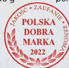
WOJNA Konc. pom.; 200 g