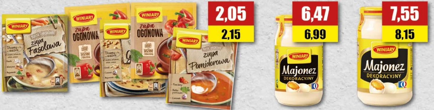
WINIARY zupa fasolowa, grochowa, grzybowa, jarzynowa, ogonowa, pomidorowa; 63 g