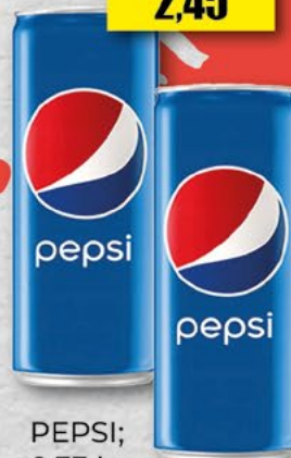
PEPSI; 0,33 l