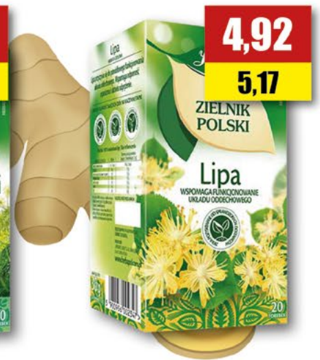
HERBAPOL lipa; 20 T