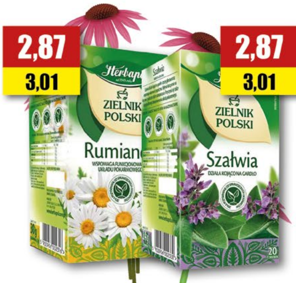
HERBAPOL szałwia, rumianek; 20 T