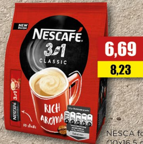
NESCAFÉ folia 3w1; (10x16,5 g)