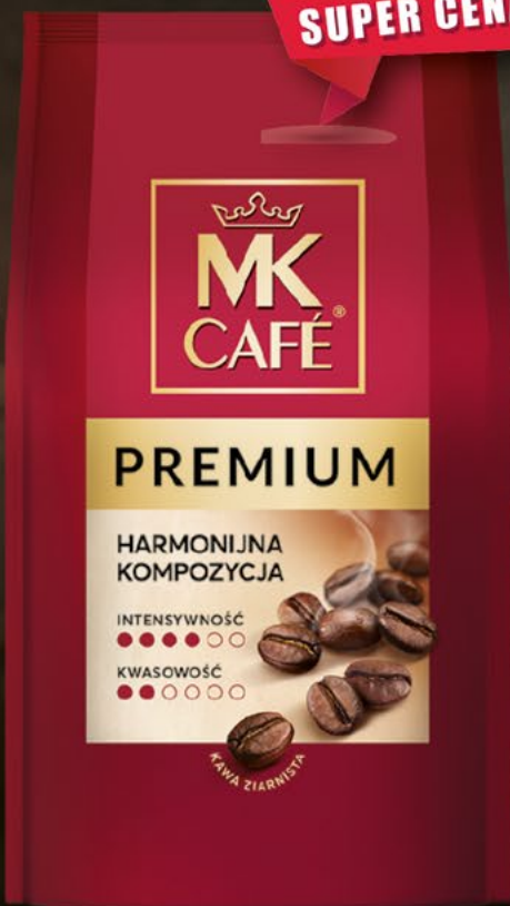
kawa ziarnista 500 g