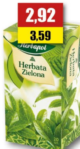
HERBAPOL Zielona exp.; 20 T