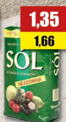
Sól kamienna niejodowana; 1 kg