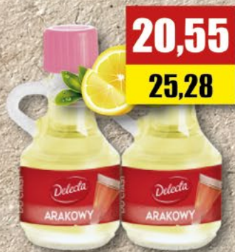
DELECTA Aromaty do ciast, asortyment; 9 ml x 20