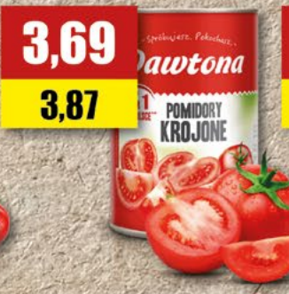
DAWTONA omidory całe, krojone; 400 g