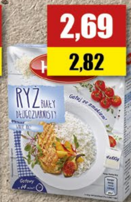
Ryz Halina; 4x100 g