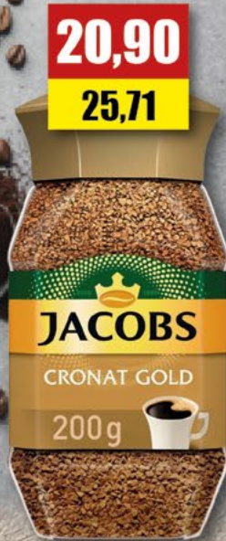
JACOBS GOLD; rozpuszczalna; 200 g