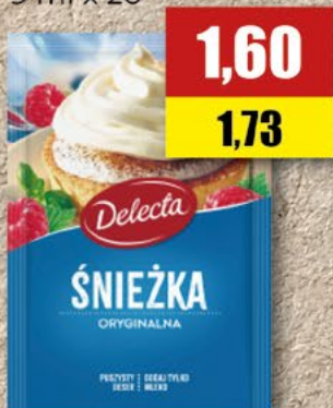
DELECTA śnieżka; 51 g