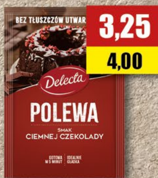
DELECTA Polewa do ciast ciemna czekolada; 100 g