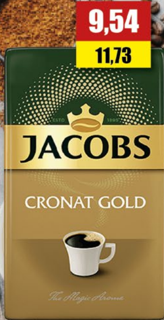
JACOBS GOLD; mielona; 250 g