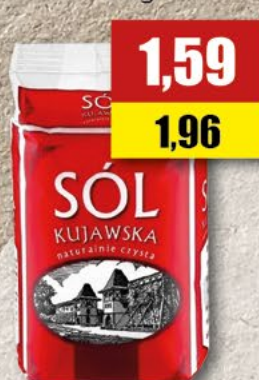
Sól kujawska; 1 g