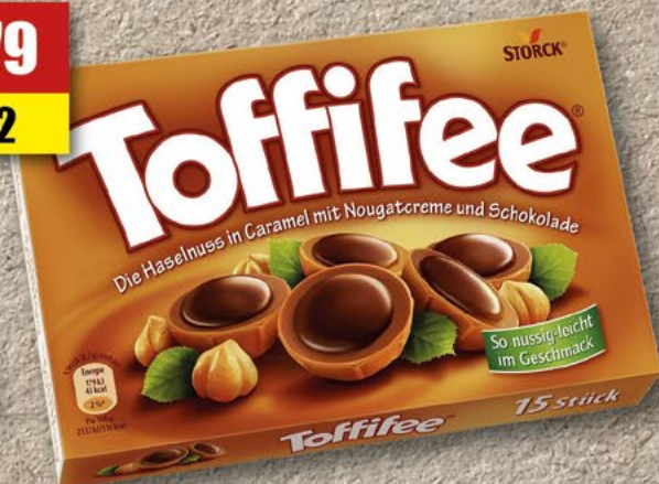
STORCK Toffifee; 125 g