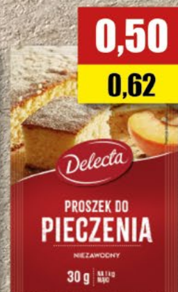
DELECTA proszek do pieczenia; 30 g