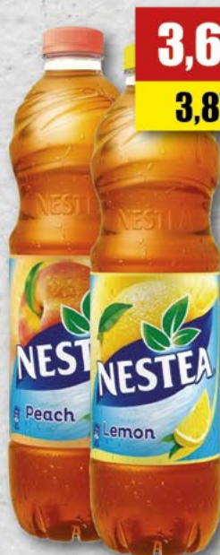
NESTEA; brzoskwinia, cytryna; 1,5 l