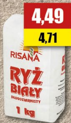
Sonko Ryz Risana; 1 kg