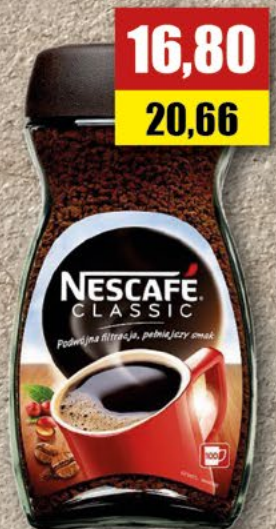
NESCAFÉ 200 g