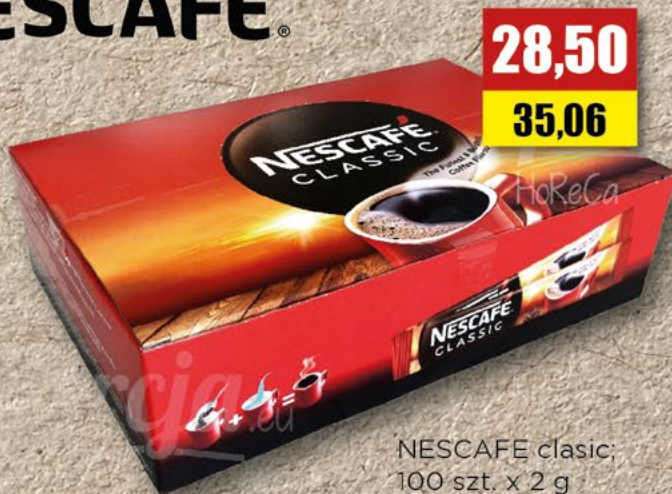
NESCAFÉ classic; 100 szt. x 2 g