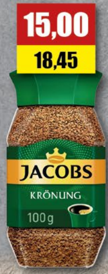
JACOBS KRONUNG rozpuszczalna; 100 g