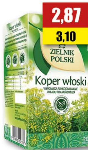
HERBAPOL koper włoski; 20 T