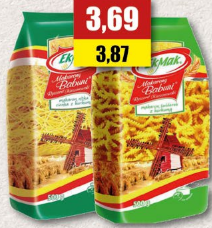
EKMAK makarony 4-jajeczne, asortyment; 500 g