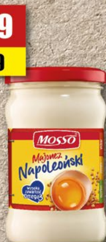
MOSSO Majonez; 320 ml