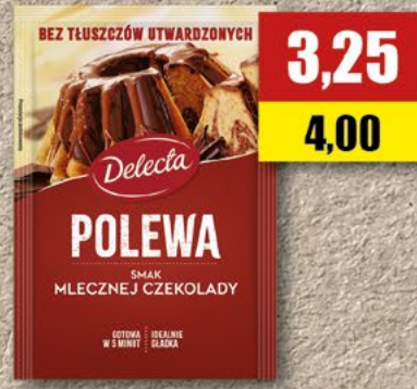
DELECTA Polewa do ciast mleczna czekolada; 100 g