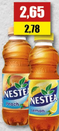
NESTEA; brzoskwinia, cytryna; 0,5 l