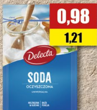
DELECTA soda; 100 g