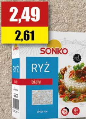
SONKO Ryż; 4x100 g