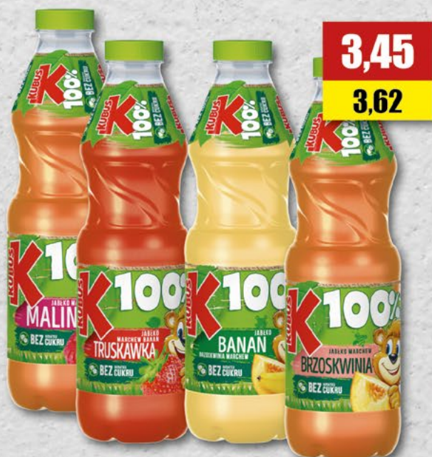
KUBUŚ PLAY; malina, pomarańcza, truskawka, 0,4 l