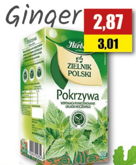
HERBAPOL pokrzywa; 20 T