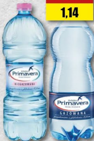
PRIMAVERA; gaz/ngaz 1 l