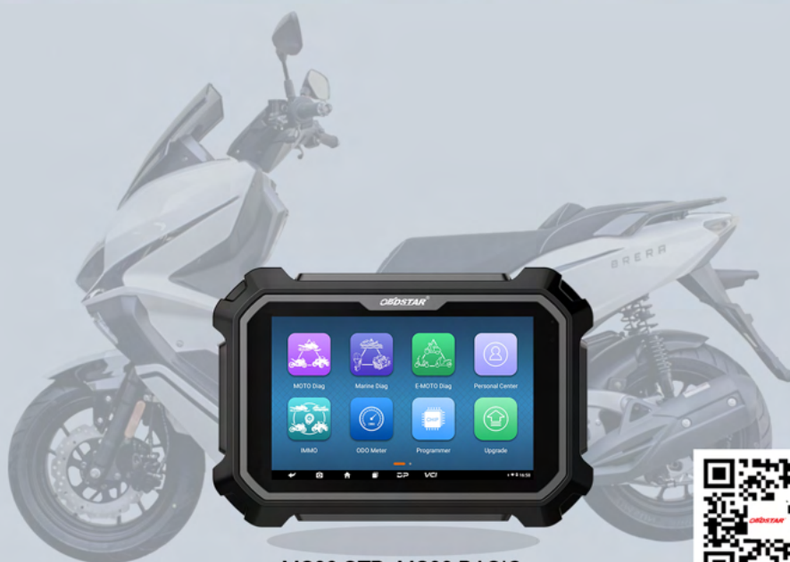
MS80 STD, MS80 BASIC