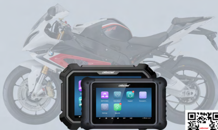
MS80 STD, MS80 BASIC, MS70

Add Control units' reset, Initialization of the tilt sensor, Front brake circuit bleeding, Rear brake circuit bleeding, Presentation mode, Control unit reset, Language Configuration, Emergency call service, Read and set the SERVICE data, Read and set the service interval for partial mileage, Reset of the mixture adaptation values, Reset of the electronic traction control adaptation values, Reset of the accelerator grip adaptation values, Reset of the throttle valve adaptation values, Reset of the gear position adaptation values, Reset of all the adaptation values, Reading/Reset of the assist adaptation values at gear shift, Reset of the knock sensor adaptation values, ESA height sensor system calibration, ESA shock absorber calibration, Front tyre pressure sensor initialisation, Rear tyre pressure sensor initialization.