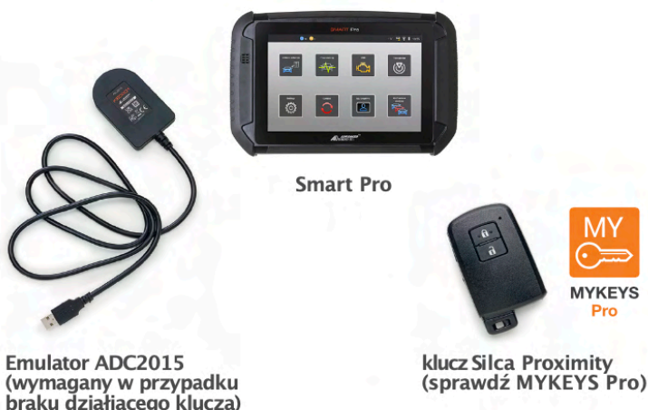
Emulator ADC2015 (wymagany w przypadku braku działającego klucza)