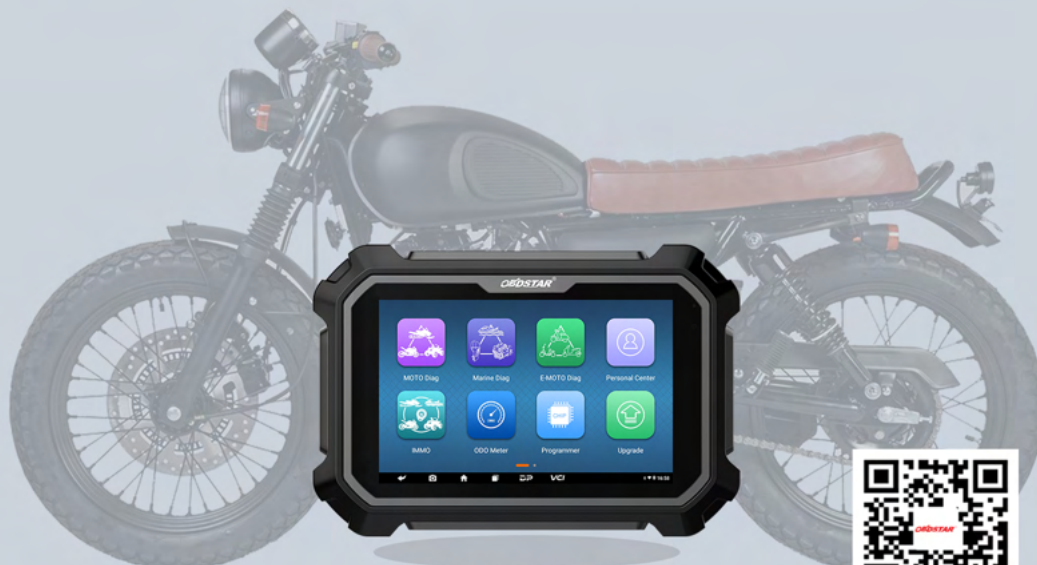
MS80 STD, MS80 BASIC

Add help data files including tips, abbreviation, diag connector, diag socket.