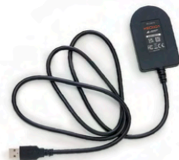
Emulator ADC2015 (wymagany w przypadku braku działającego klucza)