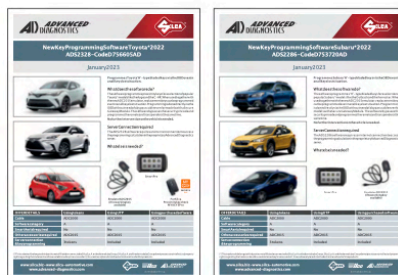
Oprogramowanie ADS2328 lub ADS2286