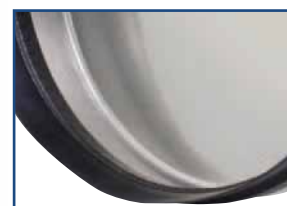
ochrona przed pryskaniem: zabezpieczenie dzięki gumowej osłonie. Osłona chroni przed chlapaniem i odpryskującymi kamieniami.

Przystawka do ścian i podadzek: 2 dysze 1/4" GZ są wymagane (*4)