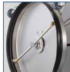
niski poziom wibracji: wyważone ramię wirnika