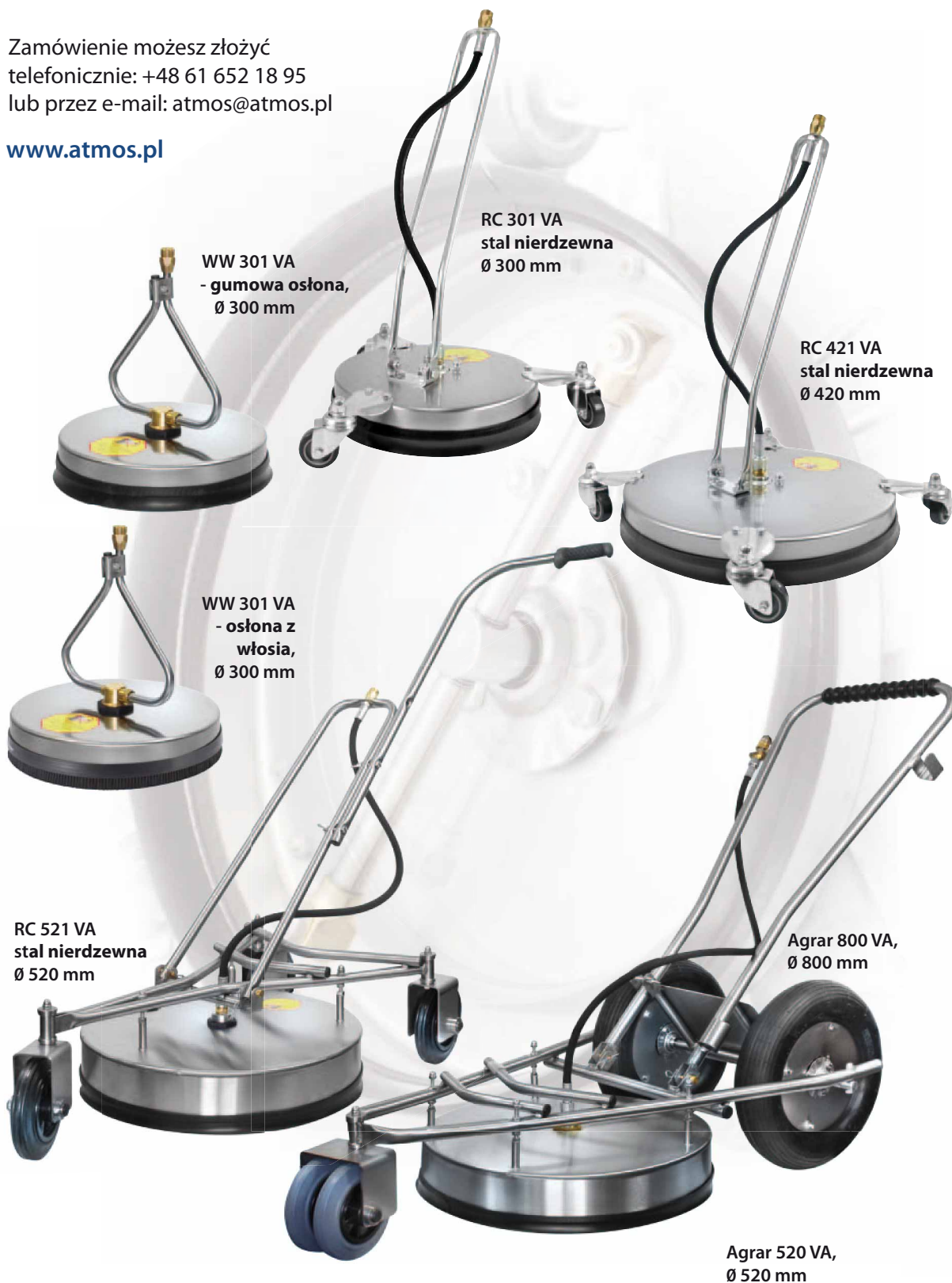
WW 301 VA - gumowa osłona, Ø 300 mm