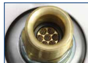
zintegrowany filtr zapobiega zabrudzeniu dyszy (z wyjątkiem: ww 301 VA)