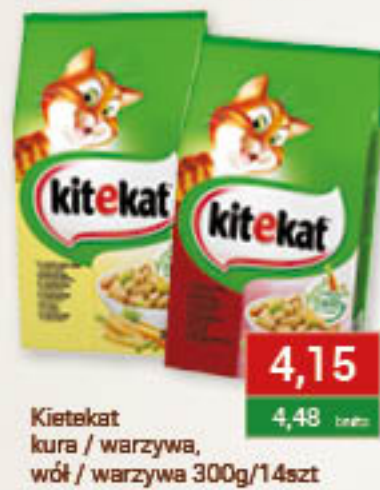
Kitekat kura / warzywa, wół / warzywa 300g/14szt