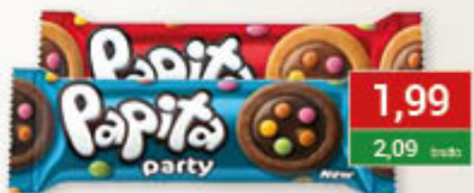
Solen Papita Party dark, milk 63g/24szt