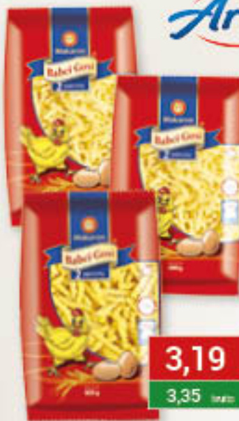
Makaron Swojski wałkowany krajanka cienka, średnia 400g / 12szt