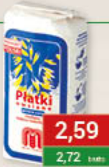
Płatki błyskawiczne owsiane górskie 500g/10szt