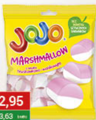
Jojo Marshmallow 36g/24szt