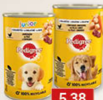
Pedigree junior kurczak, kurczak / marchew 400g/24szt