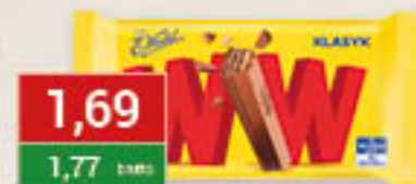
Wedel Baton WW 47g/24szt