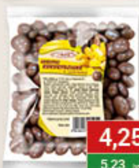
Gibbar Chrupki kukurydziane w czekoladzie 150g/40szt