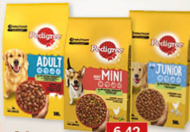
Pedigree junior / kurczak, kurczak, wół / drób 500g/16szt