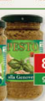
Pesto z bazyli zielone 190g/12szt