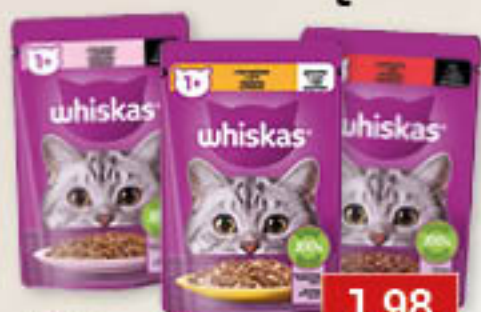
Whiskas 85g/28szt; asortyment