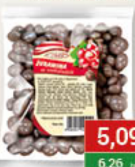
Gibbar Żurawina w czekoladzie 150g/40szt