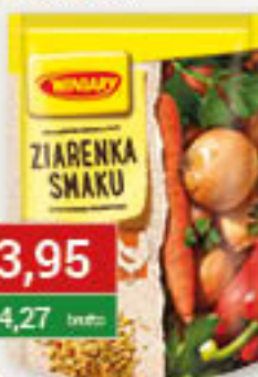
Winiary Ziarenka smaku 120g/14szt; Ziarenka smaku drobiowe 200g/12szt