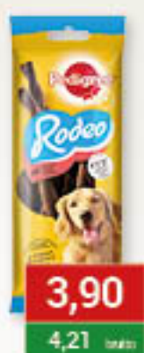
Pedigree Rodeo 70g/20szt