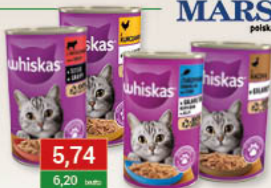
Whiskas indyk, kaczka, kurczak, tuńczyk w galaretkę, wołowina w sosie 400g/24szt