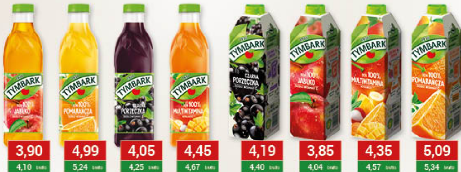
Tymbark Sok 100% jabłko 1L/6szt