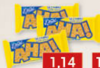
Sezamki AHA! 27,2g/40szt