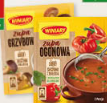
Winiary zupa fasolowa, grochowa, grzybowa, ogonowa 40-75g / 25-32szt