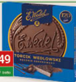
torczik wedlowski 250g/12szt