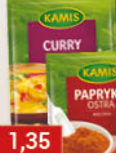
Przyprawa: curry, cynamon mielony, kminek cały, kurkuma, liść laurowy; papryka: ostra, słodka; pieprz: cytrynowy, czarny mielony, ziarnisty, zielony; zioła prowansalskie 5-20g/18-30szt