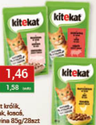
Kitekat królik, kurczak, łosoś, wołowina 85g/28szt