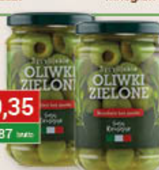
Oliwki zielone sycylijskie bez pestek 300g/6szt