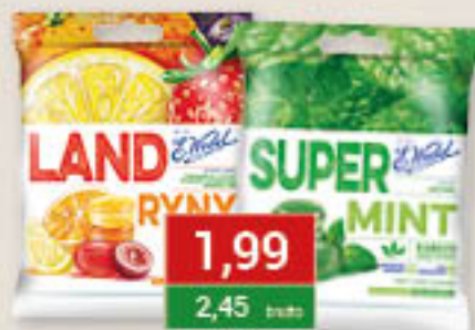
Landrynki owocowe, super mint 90g/16szt