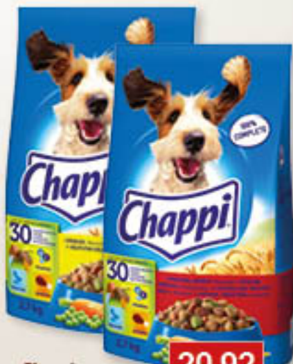
Chappi drób, wół / drób 2,7kg/3szt