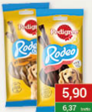
Pedigree Rodeo 122g/12szt