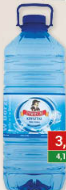
Woda niegazowana 5L