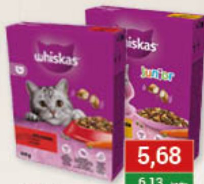
Whiskas 300g/6szt; asortyment