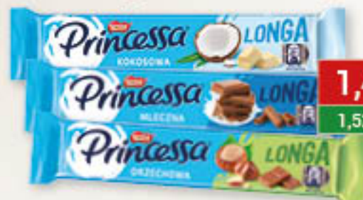
Nestlé Princessa Longa kokosowa, mleczna, orzechowa 40-45g/28szt