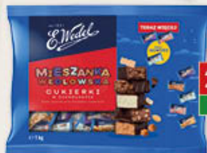
Cukierki mieszanka wedlowska 1kg