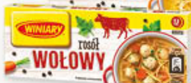
Winiary rosół drobiowy, wołowy 12 kostek 120g/16szt