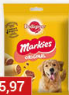
Pedigree Markies 150g/30szt