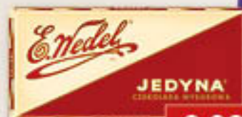
Czekolada: bajeczny, biała, gorzka 50%, 64%, 80%, jedyna, mleczna, truskawka 80-100g/20-22szt