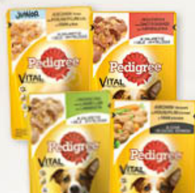
Pedigree jagnięcina, junior / kurczak, kura / warzywa, wołowina 100g/24szt