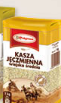
Kasza jęczmienna kłosa gruba, średnia 1kg/10szt