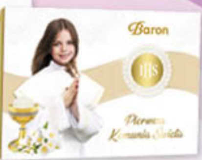
Baron bombonierka Lovely Day 115g/12szt