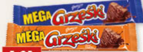
Goplana Grzeński MEGA w czekoladzie, toffi 48g/32szt