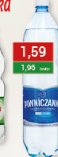
Woda delikatnie gazowana, gazowana niegazowana 1,5L/6szt