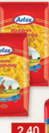
Makaron domowy muszelka, nitka, rurka, świderek, wstążka 500g/10szt