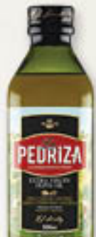
Oliwa extra virgin 0,25L/24szt