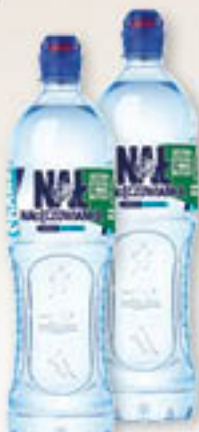
Woda niegazowana z dziubkiem 1L/6szt