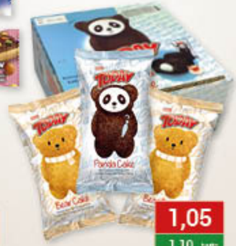
Elvan Today Bear, Panda ciastko z nadzieniem kakaowym, mlecznym 45g/24szt