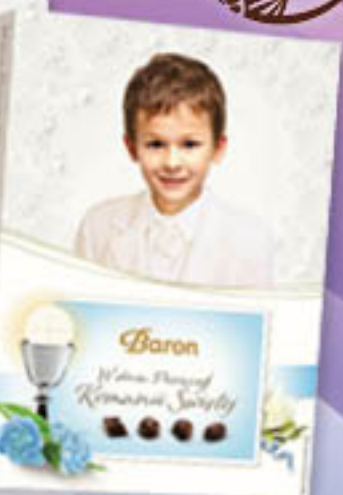
Baron bombonierka Chocolate Moment 195g/12szt