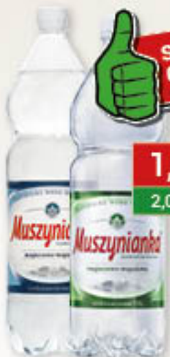
Woda gazowana, niegazowana 1,5L/6szt