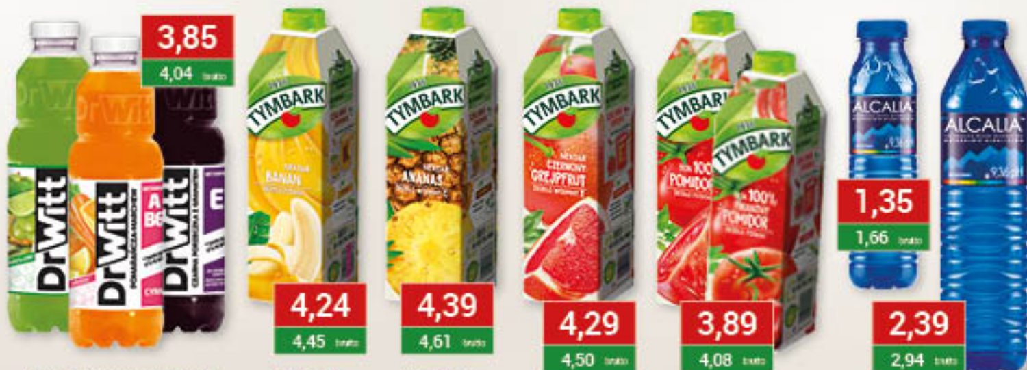
Dr Witt czarna porzeczka / granat, multiwitamina, multiwitamina: zielona, pomarańcza 1L/6szt