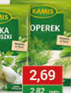
Gorczyca, Koperek Natka pietruszki 6-30g/20-25szt