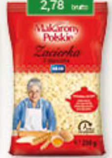
Zacierka 250g/24 szt