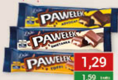
Wedel Baton Pawelek śmietanka, advocat, toffi 45-46g/224szt