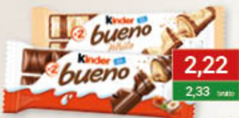
Ferrero Kinder bueno; bueno white 39-43g/15szt