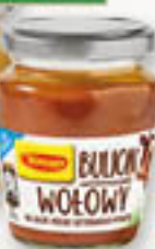
Winiary bulion w płynie drobiowy, wołowy 160g/6szt