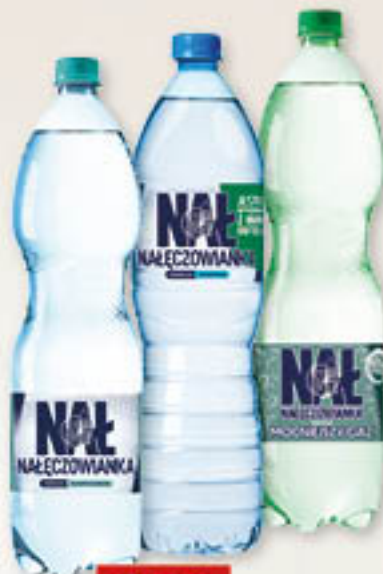
Woda gazowana, niegazowana 1,5L/6szt