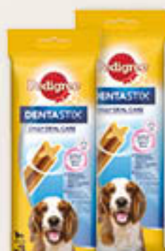
Pedigree Dentastix 77g/18szt