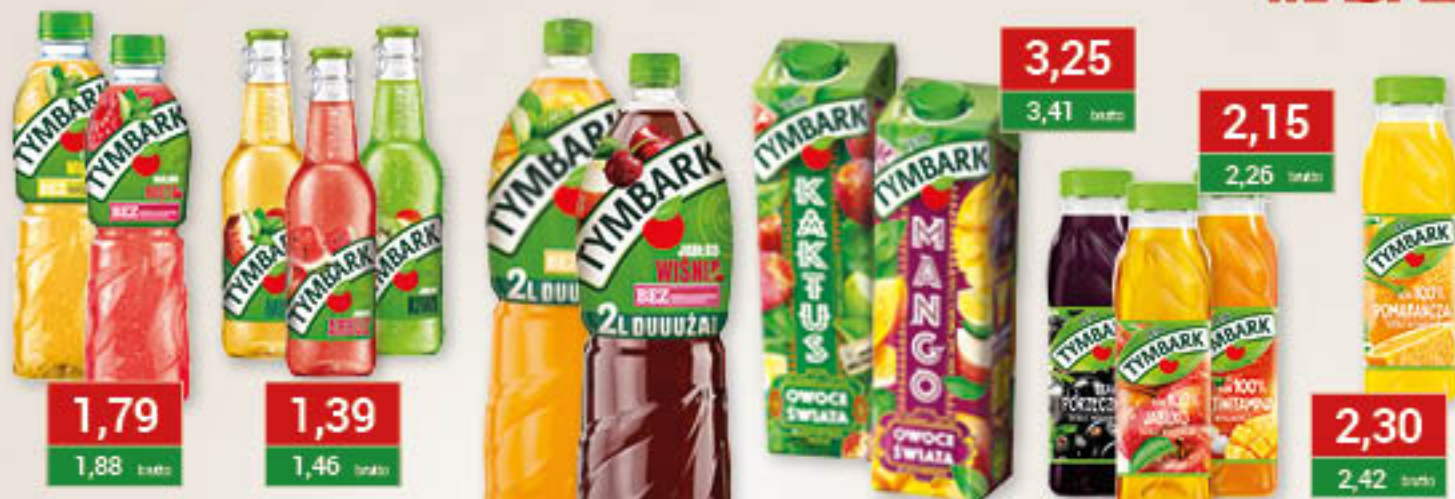
Tymbark napój 0,5L/12szt; asortyment