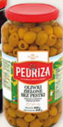
Oliwki bez pestek czarne, zielone 935ml/6szt