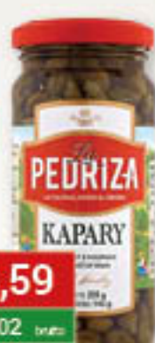
Kapary 235g / 12szt