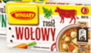
Winiary rosół warzywny, wołowy 6 kostek 60g/20 szt