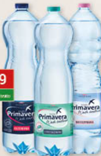
Woda gazowana, niegazowana, lekko gazowana 1L/6szt