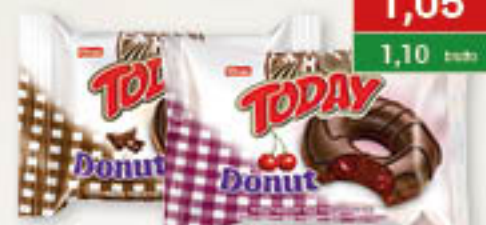
Elvan Today donut kakao, truskawka, wiśnia 50g/24szt