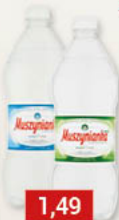
Woda gazowana, niegazowana 1L/6szt