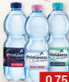
Woda gazowana, lekko gazowana niegazowana 0,5L/6szt