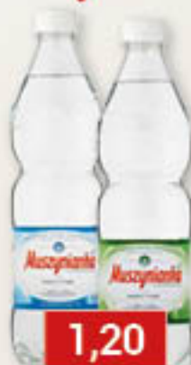
Woda gazowana, niegazowana 0,6L/8szt