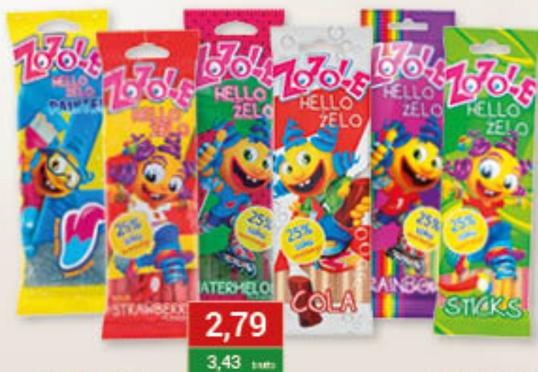
Zazole Sticks żelki cola, owocowe, painter blue, rainbow, strawberry, watermelon 75g/16-32szt