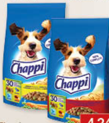
Chappi drób / warzywa, wół / drób 500g/12szt