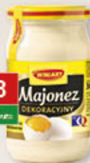
Winiary Majonez dekoracyjny 300/6szt