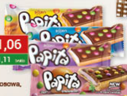
Solen Papita mleczna, kokosowa, różowa, żółta 63g/24szt