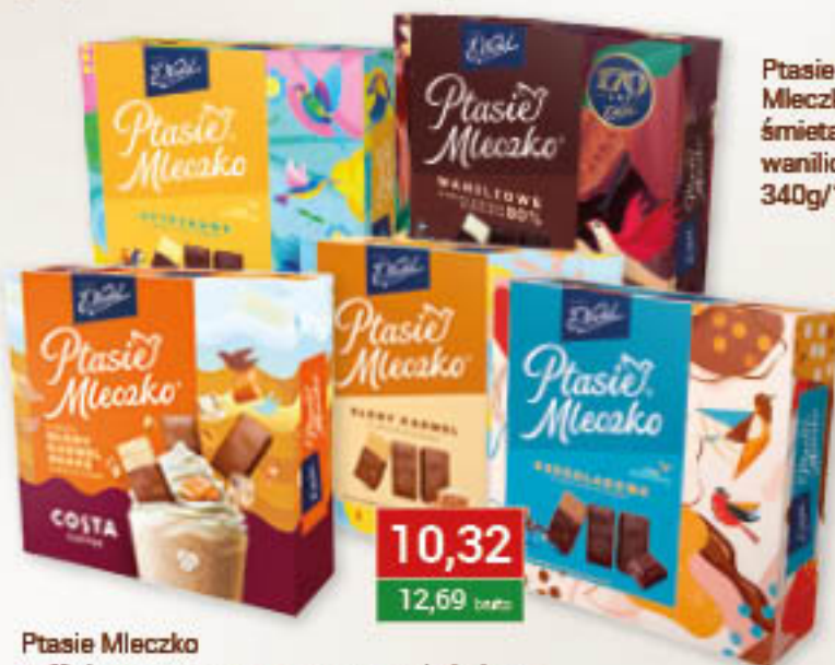
Ptasie Mleczko caffé latte, creamy, cytrynowe, czekoladowe, gorzka czekolada / wanilia, włony karmel shake 340g/18szt