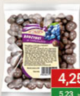
Gibbar Rodzynka w czekoladzie 150g/40szt