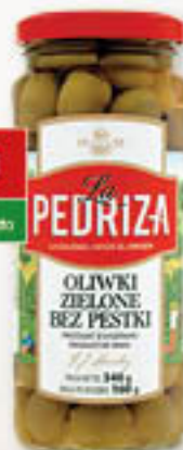
Oliwki zielone bez pestek 340g/12szt