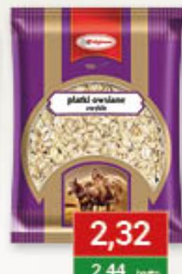
Płatki owsiane górskie 500g/10szt