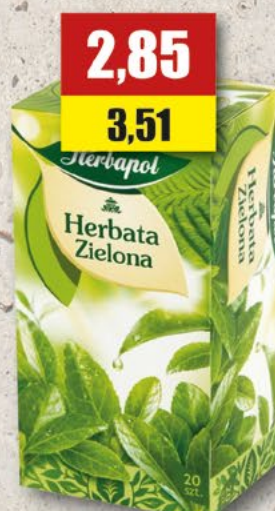
HERBAPOL Zielona exp.; 20 T