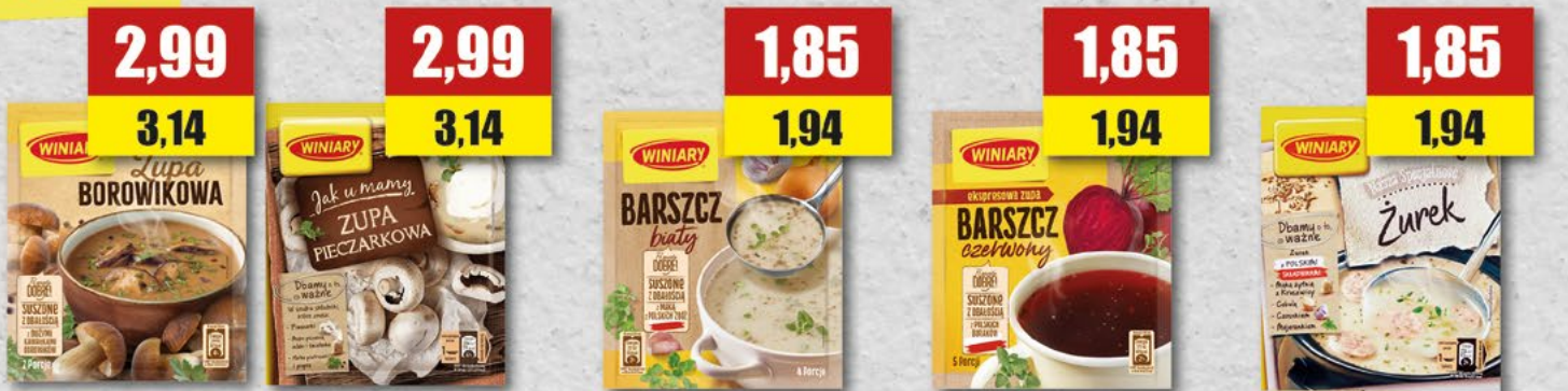
WINIARY zupa borowikowa, pieczarkowa; 45 g WINIARY zupa barszcz biały; 66 g WINIARY zupa barszcz czerwony; 66 g WINIARY zupa żurek; 60 g