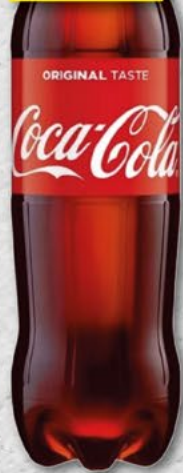
COCA COLA; 2 l