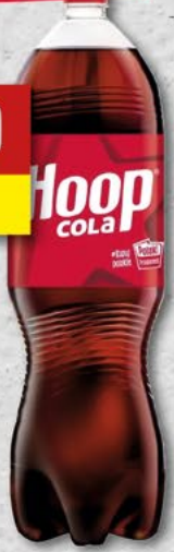
HOOP COLA; 2 l