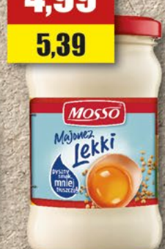
MOSSO Majonez; 200 ml