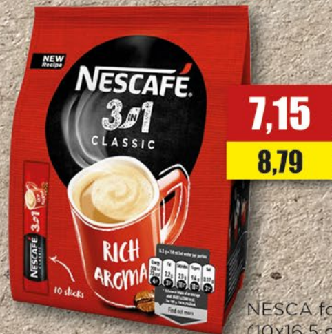
NESCAFÉ folia 3w1; (10x16,5 g)