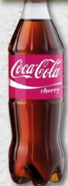
COCA COLA; cherry; 0,5 l