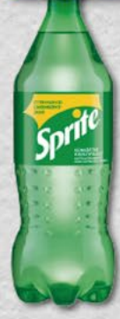
SPRITE; 0,85 l