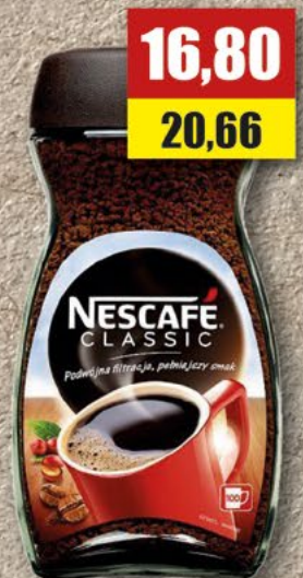
NESCAFÉ 200 g