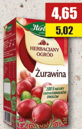
HERBAPOL żurawina; 20 T