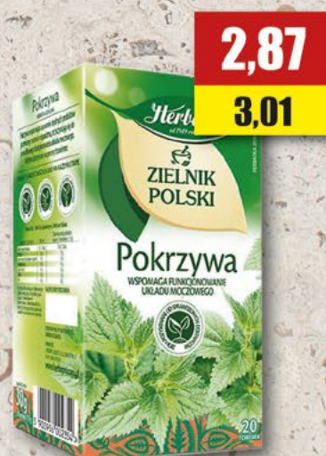
HERBAPOL pokrzywa; 20 T