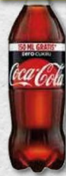
COCA COLA; zero; 0,5 l