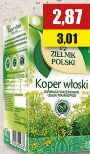
HERBAPOL koper włoski; 20 T