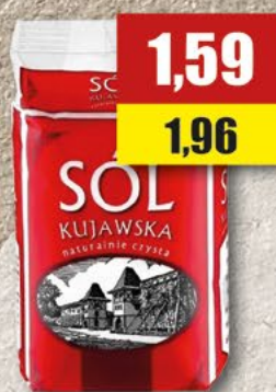
Sól kujawska; 1 g