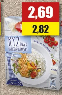
Ryż Halina; 4x100 g