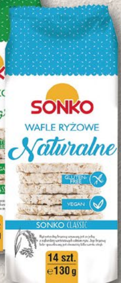
SONKO Wafle ryżowe solone, ryżowo/dyniowe, ryżowo/słonecznikowe, naturalne; 130 g