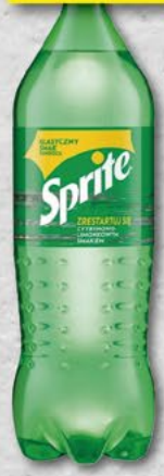
SPRITE; 1,5 l