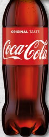
COCA COLA; 1,5 l