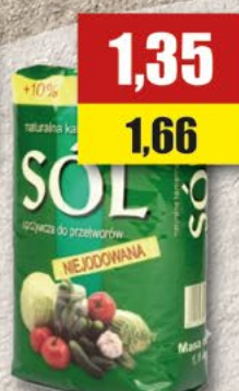
Sól kamienna niejodowana; 1 kg