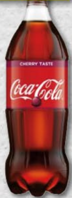
COCA COLA; cherry; 0,85 l