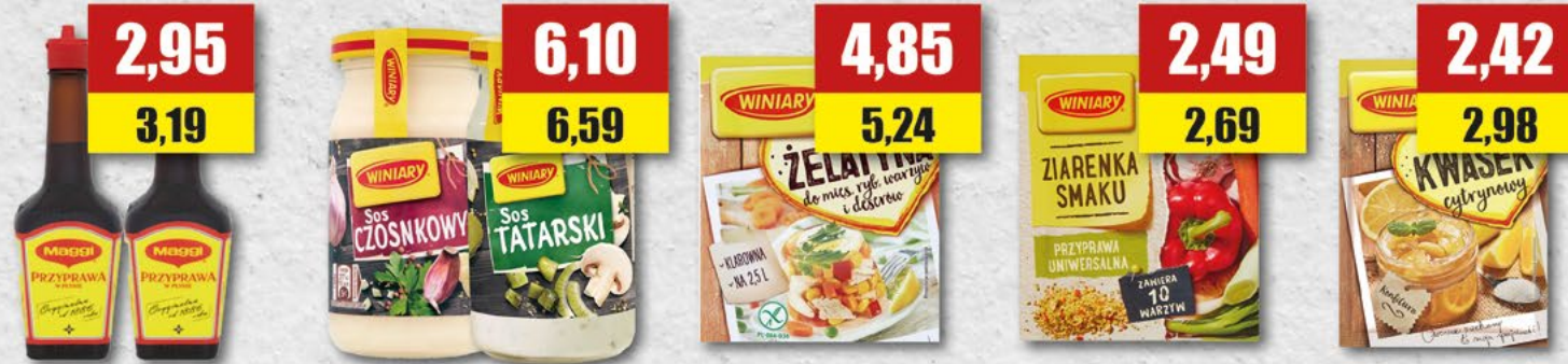
WINIARY maggi; 200 ml WINIARY sos czosnkowy, Tatarski; 250 ml WINIARY żelatyna; 50 g WINIARY ziarenka smaku; 120 g WINIARY kwasek cytrynowy; 50 g