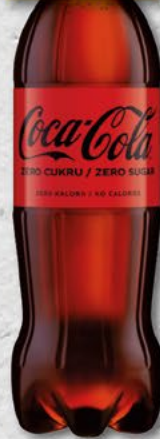
COCA COLA; zero; 1,5 l