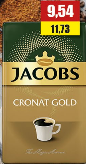
JACOBS GOLD; mielona; 250 g