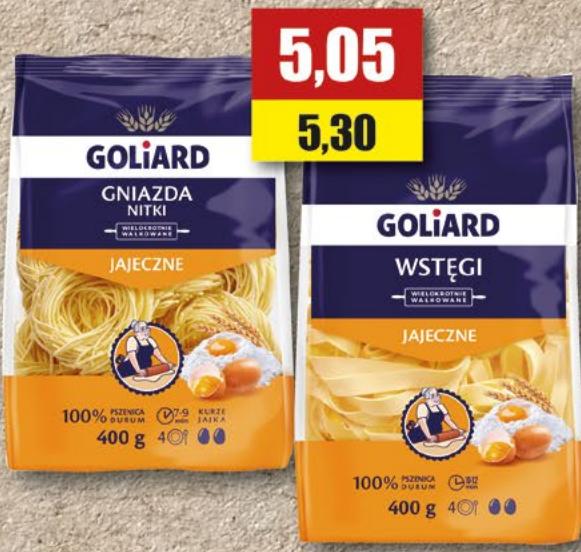
GOLIARD gniazda grube, średnie, wstęga, gwiazdka; 400 g