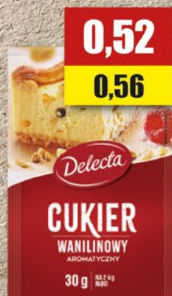
DELECTA cukier waniliowy;