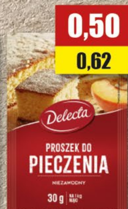
DELECTA proszek do pieczenia; 30 g