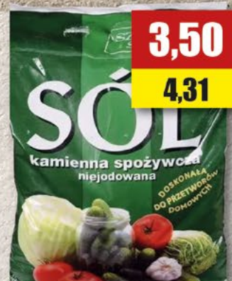
Sól kamienna niejodowana; 3 kg