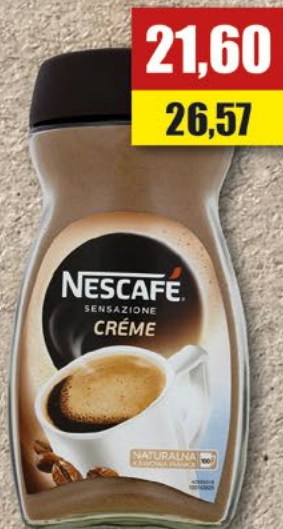
NESCAFÉ CRÈME; 200 g