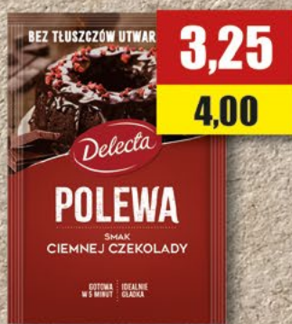
DELECTA Polewa do ciast ciemna czekolada; 100 g