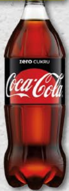
COCA COLA; zero; 0,85 l