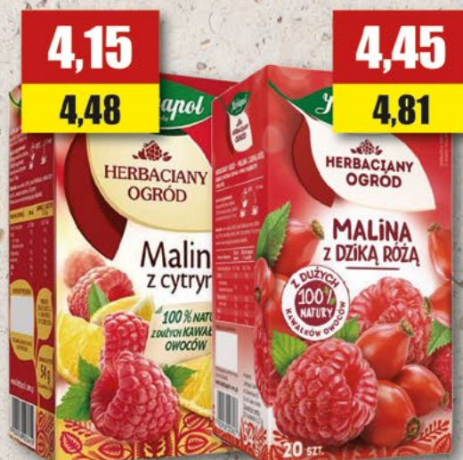
HERBAPOL asortyment; 20 T