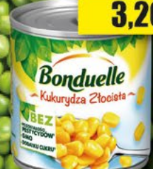
BONDUELLE Kukurydza; 340g