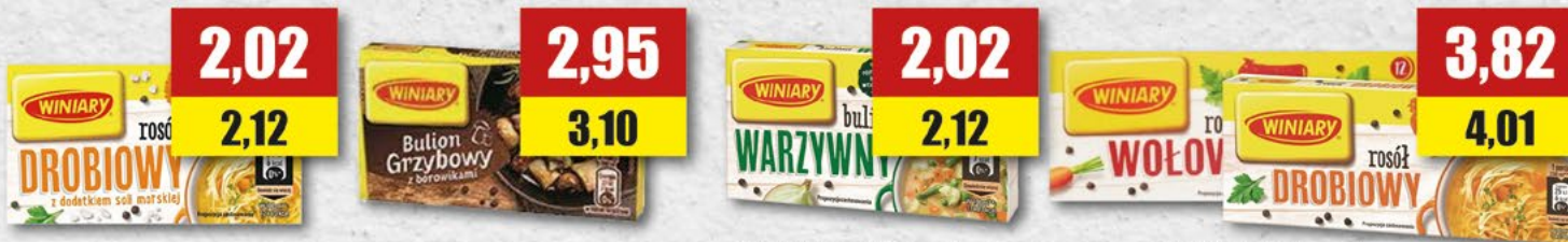
WINIARY kostka drobiowa; 60 g WINIARY kostka grzybowa; 60 g WINIARY kostka warzywna; 60 g WINIARY kostka wołowa, drobiowa; 120 g