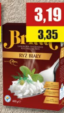
BRITTA ryż; 4x100 g