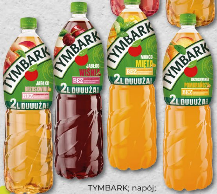
TYMBARK; napój; różne smaki; 2 l