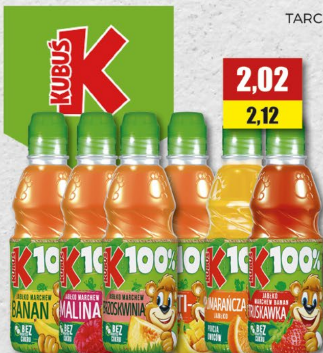
TARCZYN; różne smaki; 0,33 l