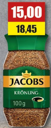
JACOBS KRONUNG rozpuszczalna; 100 g