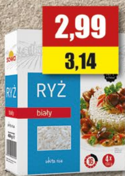
SONKO Ryż; 4x100 g