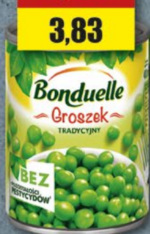
BONDUELLE Groszek; 400 ml