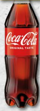
COCA COLA; 0,5 l