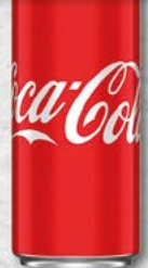
COCA COLA; 0,33 l