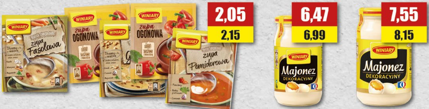
WINIARY zupa fasolowa, grochowa, grzybowa, jarzynowa, ogonowa, pomidorowa; 63 g WINIARY majonez Dekoracyjny; 300 ml WINIARY majonez Dekoracyjny; 400 ml