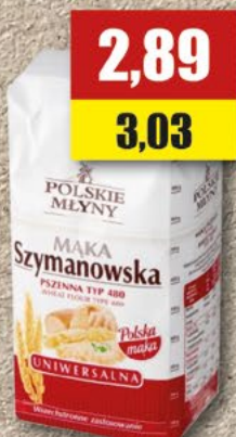
Mąka Szymanowska; TYP 480; 1 kg