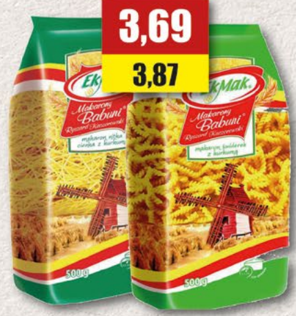
EKMAK makarony 4-jajeczne, asortyment; 500 g