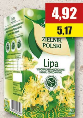
HERBAPOL lipa; 20 T