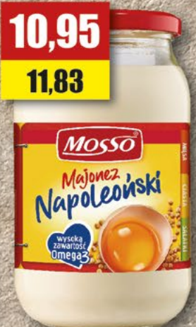
MOSSO Majonez; 320 ml