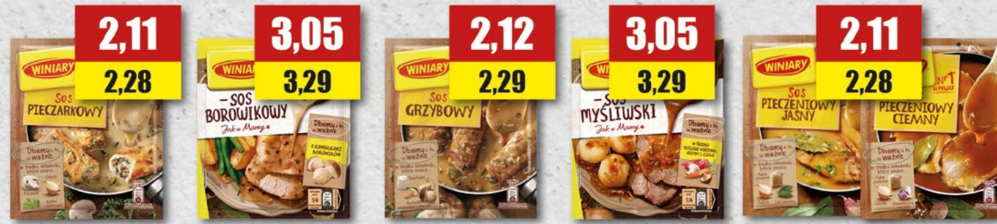
WINIARY sos pieczarkowy; 33 g WINIARY sos borowikowy; 33 g WINIARY sos grzybowy; 33 g WINIARY sos myśliwski; 33 g WINIARY sos pieczeniowy jasny, ciemny; 27 g