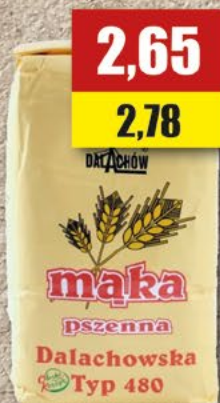
Mąka Dalachów; 1 kg