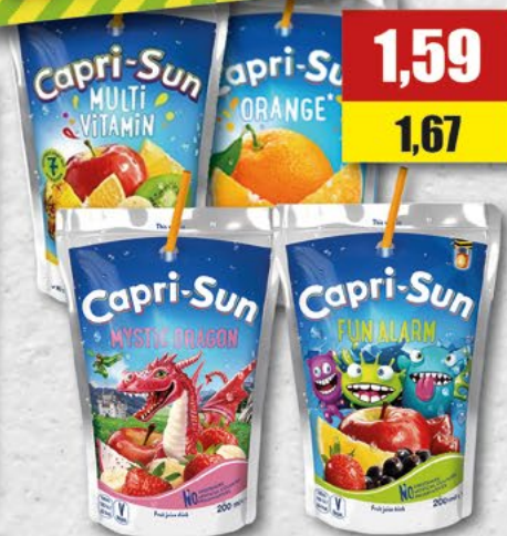
CAPRI-SUN; asortyment; 0,2 l