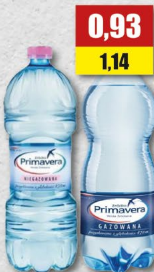
PRIMAVERA; gaz/ngaz 1 l