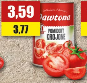
DAWTONA omidory całe, krojone; 400 g