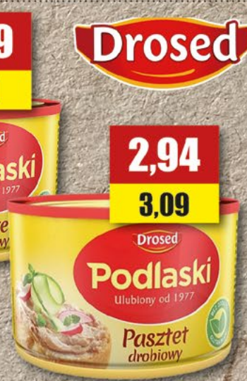
DROSED; Pasztet podlaski; 155 g