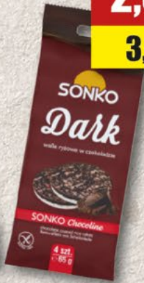
SONKO wafle ryżowe w polewie czek. deserowej/mlecznej; 65 g