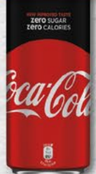
COCA COLA ZERO 0,33 l