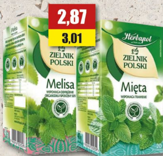
HERBAPOL melisa, mięta; 20 T