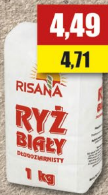
Ryż Risana; 1 kg