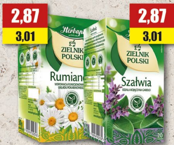
HERBAPOL szałwia, rumianek; 20 T