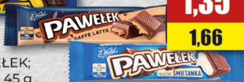
Baton PAWELEK; różne smaki; 45 g