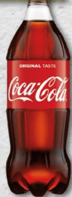
COCA COLA; 0,85 l