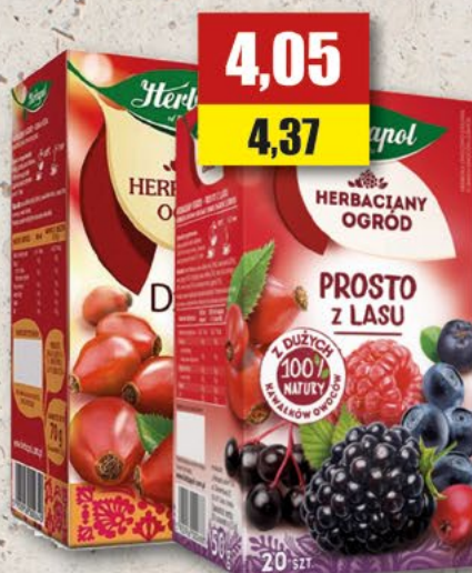
HERBAPOL asortyment; 20 T