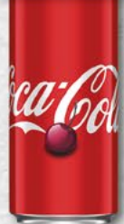
COCA COLA cherry; 0,33 l