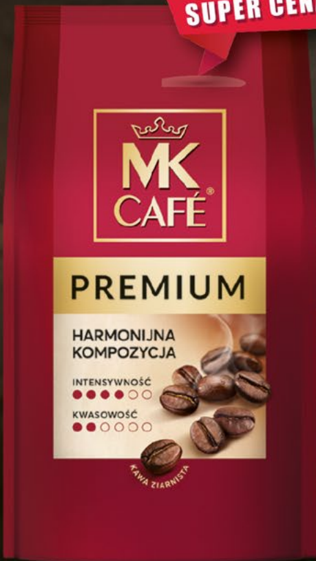
kawa ziarnista 500 g