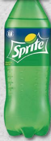
SPRITE; 2 l